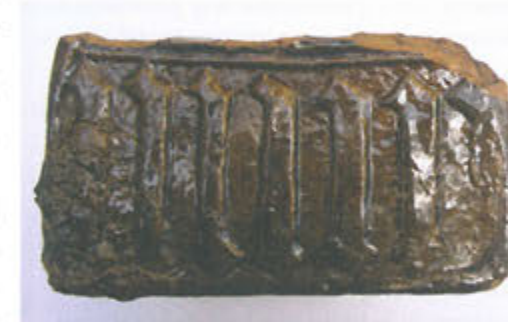
Slika 18. Pečnjak sa zubima

Zanimljiv je i jedan čitav pečnjak sa „zubima“, odnosno radi se o motivu koji imitira gotički tekst (sl. 18). Prednja ploča pravokutnog je oblika, veličine 18 x 10 cm, te prekrivena glazurom smeđe