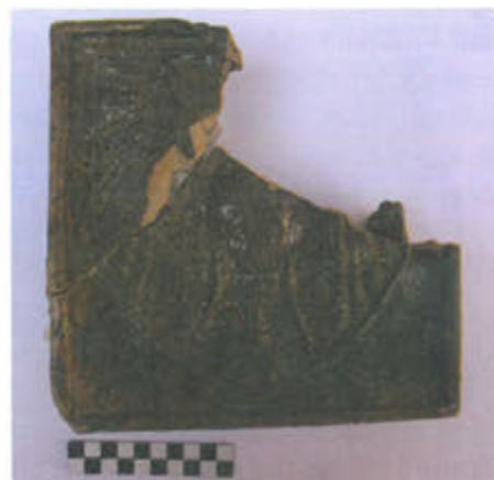
Slika 16. Pečnjak s prikazom orla raširenih krila

Na pečnjacima s prednjom dekorativnom pločom javlja se i motiv peterolatične rozete (sl. 17). Svi ulomci prekriveni su glazurom zelenosmede boje. Kod tih pečnjaka vanjski je rub izdignut i gore zaravnan te nakošen prema unutrašnjosti. On čini vanjski okvir. Prostor između sljedećeg, jednostavnog okvira i trećeg ispunjen je vegetabilnim motivom u obliku neprekinute trake. Unutar trećeg okvira nalazi se motiv kružnice s peterolatičnom rozetom te izvan kružnice motivi listova koji ispunjavaju uglove. Najbliže su usporedbe s ulomcima pronađenima na Ružica gradu koji se datiraju u drugu polovicu 15. i početak 16. st. (Radić, Bojčić, 2004., str. 245, kat. 512, 513). Prema Hollovoj tipologiji, radi se o tipu 16 koji se javlja na nekim lokalitetima u Mađarskoj, i to u kraljevskoj palači u Budimu, cistercitskom samostanu u Pilisszentkereszt, pavlinskom samostanu Pilis – Szt. Lélek te trgovištu Muhi (Holl, 1998., str. 153; 154, Abb. 19; str. 178; Holl, Balla, 1994., str. 389, Abb. 6).