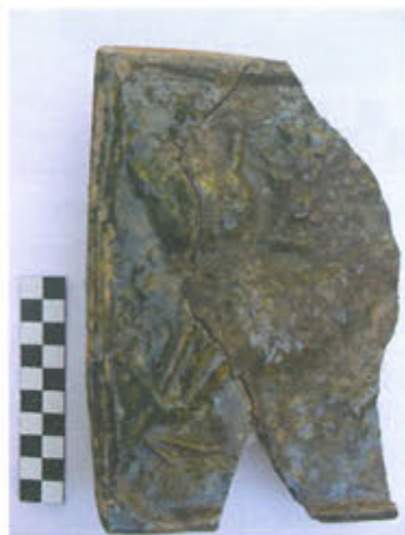
Slika 19. Ulomak pećnjaka s prikazom maske

Pronađeno je nekoliko ulomaka pećnjaka koji se mogu usporediti s ulomcima pronađenima na Ružici gradu, no nejasno je o kojem se motivu radi (sl. 19, 20). Mladen Radić taj je motiv prepoznao kao motiv maske (lika) s dugim uskim ušima, a datira ga u prvu polovicu 15. st. (Radić, Bojčić, 2004., str. 241, kat. 502).