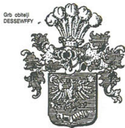
Slika 15. Grb obitelji Dessewffy

Ulomci pečnjaka s heraldičkim motivom orla raširenih krila, najvjerojatnije prikazuju grb obitelji Dessewffy koji su od 1525. godine potvrđeni patroni samostana na Rudini (sl. 15). Te iste godine kralj Ludovik II. obnovio je njihovu grbovnicu, koja se ponešto razlikuje od prikaza na pečnjacima. Nažalost, prikaz na pečnjacima nije moguće u cijelosti rekonstruirati jer nedostaju gornji dijelovi pečnjaka (sl. 16).