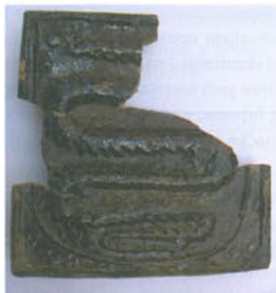
Slika 13. Pečnjak s motivom grba Gorjanskih