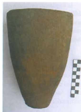
Slika 5. Pećnjak u obliku čaše

stavljenih ispod ravnog oboda koje sežu gotovo do sredine pećnjaka (sl. 8). Na drugom pećnjaku, također ispod oboda, urezane su plitke višestruke horizontalne linije.