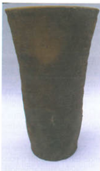
Slika 4. Pećnjak u obliku čaše

je veći broj ovog tipa. Oni su jednostavnog izgleda, ali grube izrade s neravnim stijenama i uglavnom bez ukrasa (sl. 3). Imaju ravna dna koja su uža od otvora. Sačuvano je samo nekoliko cijelih primjeraka koji se međusobno razlikuju po dimenzijama i oblicima. Ističe se pećnjak (sl. 4) u obliku čaše nešto finije izrade