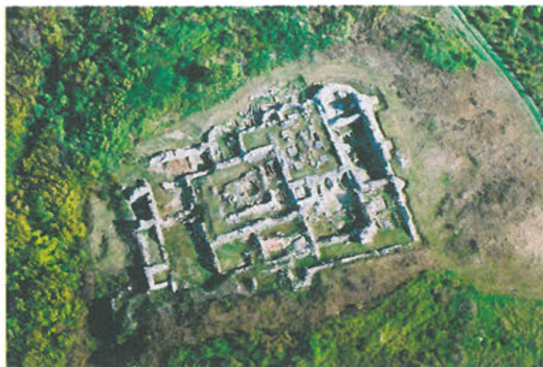
Slika 1. Rudina benediktinska opatija sv. Mihovila

Višegodišnjim arheološkim istraživanjima 1 otkriven je valik sakralni kompleks koji je pripadao benediktincima, najstarijem katoličkom redu. Prva arheološka istraživanja započela su 1980. godine na zapadnom dijelu platoa i rezultirala su otkrićem male romaničke jednobrodne crkve s polukružnom apsidom, dimenzija 11,40 x 5,90 m (Sokač – Štimac, 1980.; 1997., str. 18). Građena je kamenom lomljenjem i većim komadima sprijeda obrađenog kamena, a tipološki se dovodi u vezu s ranoromaničkom crkvom sv. Ilije na Meraji u Vinkovcima koja datira iz vremena oko 1100. godine (Sekulić-Gvozdanović, 2007., str. 40).