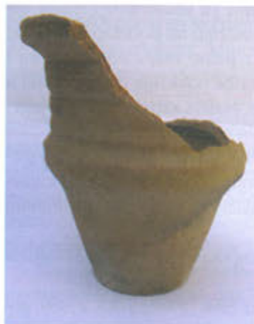
Slika 3. Pećnjak u obliku čaše

Pećnjaci u obliku čaše pripadaju grupi pećnjaka koji su prema van otvoreni. Na lokalitetu Rudina pronađen