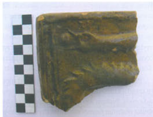
Slika 14. Ulomak pečnjaka s prikazom grba Gorjanskih

1430. godine (Kozak, 1981., str. 189, Abb. 5,3, str. 197). Ulomci pečnjaka s prikazom grba Gorjanskih pronađeni su i na Ružici gradu (Radić, Bojčić, 2004., str. 279, kat. 586, 587), što je posve razumljivo s obzirom na to da je Job Gorjanski bio oženjen Eufrozinom, sestrom Lovre Iločkog, u čijem je vlasništvu bio Ružica grad, a datiraju se u drugu polovicu 15. st. Veze Gorjanskih sa samostanom na Rudini nisu tako jasne.