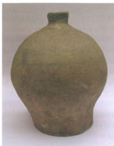
Slika 9. Pećnjak u obliku lukovice

Na Rudini je taj tip pećnjaka znatno manje zastupljen nego tip pećnjaka u obliku čaše. Sačuvana su samo dva čitava primjerka koja se razlikuju i izgledom i veličinom. Manji pećnjak, visine 13,5 cm, jednostavnog je oblika, tankih stijenki, bez ukrasa. Sastoji se od oboda oblika nepravilnog kruga, valjkastog dijela koji postupno prelazi u lukovicu s izraženim trbuhom te završetkom u obliku kružnog ispupčenja (sl. 9). Sačuvan je i jedan ulomak gornjeg dijela pećnjaka u obliku lukovice čiji je završetak u obliku šiljka.