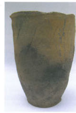
Slika 8. Pećnjak u obliku čaše