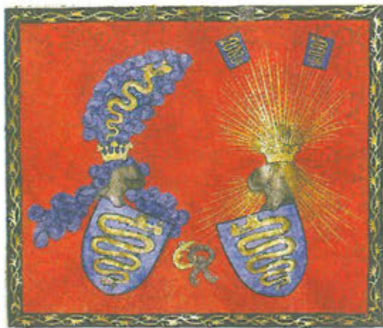
Slika 12. Grbovnica palatina Nikole Gorjanskog, detalj

Svi ulomci pečnjaka s prikazom grba Gorjanskih s lokaliteta Rudine bili su prekriveni glazurom smeđe i zelene boje. Prednja dekorativna ploča bila je kvadratnog oblika, veličine 19 x 19 cm, a prikazuje unutar štita zmijolikog zmaja s krunom na glavi i vladarskom jabukom u ustima (sl. 13, 14). Taj motiv javlja se i na pečnjacima s lokaliteta benediktinske opatije u Vértesszentkereszt u Mađarskoj, no taj je primjerak znatno raniji i datira iz vremena oko