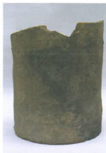
Slika 7. Pećnjak u obliku čaše

Kod jednog primjerka dno je malo izvučeno prema van (sl. 6). Sličan primjerak s blago izvučenim dnom nalazimo i na Ružici gradu (Radić, Bojčić, 2004., str. 232, kat. 478). Sačuvano je i nekoliko pećnjaka s gotovo okomitim stijenama (sl. 7.) čije analogije također nalazimo među sačuvanim pećnjacima s Ružice grada (Radić, Bojčić, 2004., str. 232, kat. 477).