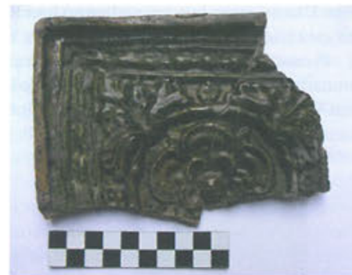
Slika 17. Ulomak pečnjaka s motivom rozete

Na pečnjacima s prednjom dekorativnom pločom javlja se i motiv peterolatične rozete (sl. 17). Svi ulomci prekriveni su glazurom zelenosmede boje. Kod tih pečnjaka vanjski je rub izdignut i gore zaravnan te nakošen prema unutrašnjosti. On čini vanjski okvir. Prostor između sljedećeg, jednostavnog okvira i trećeg ispunjen je vegetabilnim motivom u obliku neprekinute trake. Unutar trećeg okvira nalazi se motiv kružnice s peterolatičnom rozetom te izvan kružnice motivi listova koji ispunjavaju uglove. Najbliže su usporedbe s ulomcima pronađenima na Ružica gradu koji se datiraju u drugu polovicu 15. i početak 16. st. (Radić, Bojčić, 2004., str. 245, kat. 512, 513). Prema Hollovoj tipologiji, radi se o tipu 16 koji se javlja na nekim lokalitetima u Mađarskoj, i to u kraljevskoj palači u Budimu, cistercitskom samostanu u Pilisszentkereszt, pavlinskom samostanu Pilis – Szt. Lélek te trgovištu Muhi (Holl, 1998., str. 153; 154, Abb. 19; str. 178; Holl, Balla, 1994., str. 389, Abb. 6).