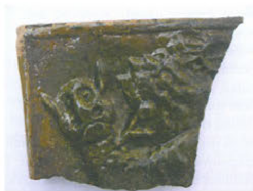
Slika 20. Ulomak pećnjaka s prikazom maske, detalj

Nekoliko manjih ulomaka pripadalo je tipu poluvaljkastog pećnjaka s otvorenom nišom prema van (sl. 21). Tip poluvaljkastog pećnjaka javlja se krajem 14. st. Sastoji se od stražnjeg dijela u obliku posude poluvaljkastog izgleda koji se izrađivao na lončarskom kolu. Prednji dio pećnjaka mogao je biti otvoren i rubno ukrašen reljefnim ukrasima koji oponašaju gotičku arhitekturu ili je imao prednju dekorativnu ploču ukrašenu na proboj. Dodatno su