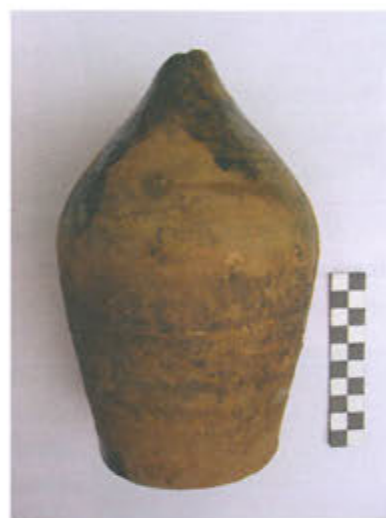
Slika 10. Pećnjak u obliku lukovice

Veći pećnjak, visine 19 cm, fine je izrade, tankih stijenki i crvenkaste boje (sl. 10). Ima obod ovalnog oblika. Nažalost, pećnjak je oštećen, vrh koji je bio prekriven zeleno-smeđom glazurom nije sačuvan.