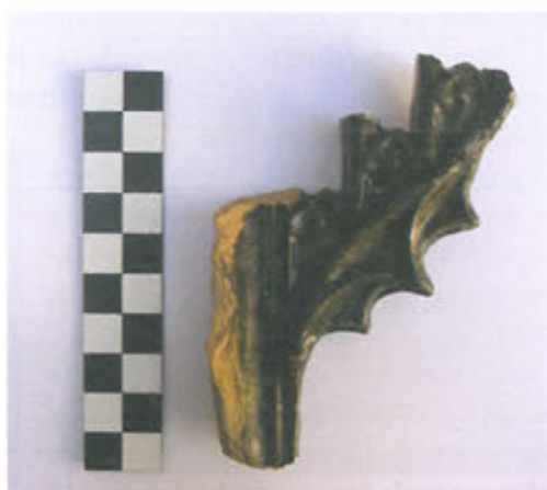
Slika 21. Ulomak poluvaljkastog pećnjaka

se ukrašavali i različitim figurama izrađenim u punoj plastici npr. vitezovi na konju, anđeli nositelji grbova i sl., no na Rudini nisu pronađeni ulomci takvih figura. Taj tip pećnjaka koristio se tijekom čitavog 15. st., a već u 16. st. polagano nestaje. Bio je smješten u gornjem dijelu kaljeve peći, dok je tip pećnjaka s prednjom dekorativnom pločom bio smješten u donjem dijelu peći (Tomičić, Tkalčec, Dizdar, Ložnjak, 2001., str. 266).