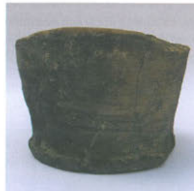
Slika 6. Pećnjak u obliku čaše

Najveći sačuvani pećnjak u obliku čaše (sl. 5), visine 20,5 cm, također je jednostavnog oblika i bez ukrasa. Stijenke su mu neravne i nakošene prema van, a otvor je znatno širi od dna.