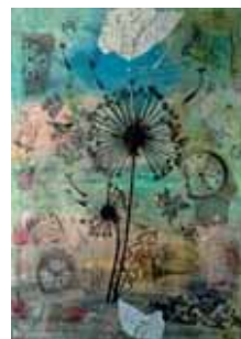
Melita Grgić: Prolaznost, 2014., mix media, 50x70 cm

3. MELITA GRGIĆ rođena 1967. godine u Požegi. Od ranih školskih dana zanimala se za sve oblike likovnog izražaja. Ova inženjerka agronomije i službenica, danas svoju likovnost razvija i njeguje izrađujući nakit i slike od suhog cvijeća, te slika akrilom i akvarelom. Decoupage tehnikom ukrašava predmete i namještaj, dok u posljednje vrijeme intenzivno tehnikom tzv. mix media slikarski izražava svoje misli i ideje.