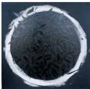
"RibeListi", 2013., 30x30, akrilik