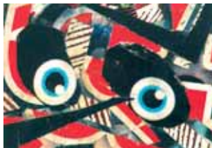
Luko Paljetak: Minijatura, kolaž

Matica hrvatska - Ogranak u Požegi i Gradski muzej Požega organizirali su u izložbenom prostoru požeškog muzeja izložbu likovnih djela hrvatskog akademika, pjesnika, pisca, prevoditelja i esejiste Luke Paljetka. Izložbom se prezentira 1111 neobičnih minijatura u tehnici kolaža koji su rezultat autorove bogate imaginacije. Na ujednačenim, ali preoblikovanim pločicama insekticida za električne aparate, koristeći svakodnevno dostupan materijal, novine, časopise, plakate, prospekte, reklame, ukrasni i ambalažni papir, folije, celofan i naljepnice, Luko Paljetak stvarao je maštom svoje novo djelo dajući organizatorima, kustosima muzeja da ga u svojim prostorima oblikuju u nove cjeline.