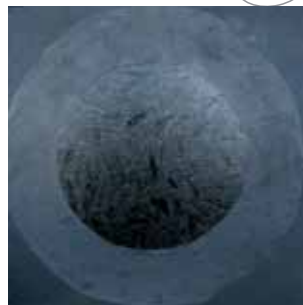
"RibeListi", 2013., 30x30, akrilik

„Titranje života u staničju, gledanu kroz mutnu opnu embrija, u kratkom i beskonačnom vremenu između stvaranja i ništenja, koncentriranja i rasipanja -strujanje i vrtloženje elementarnih čestica... Umjetnost živi u dodiru propuha na papiru iz kutije od cipela, u harmoniji samo nekoliko nijansi sive - i 50 je previše. Umjetnost iznad i izvan predmetnog svijeta, tako nesavršenog. U potrazi za znakom, simetrijom, simbolom, jednim i jednom -dovoljnim sami sebi; RibeListi Mire Vitenberg.“