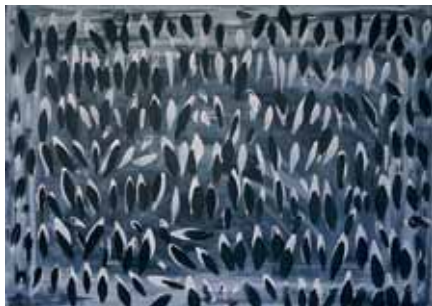
"Ptice", 2013., 70x50, akrilik

„Kasno popodnevna kava pretvorila se u pravi vizualni doživljaj.