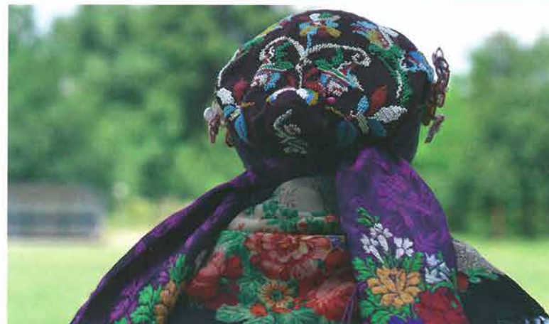
Rekonstrukcija postavljanja poculice