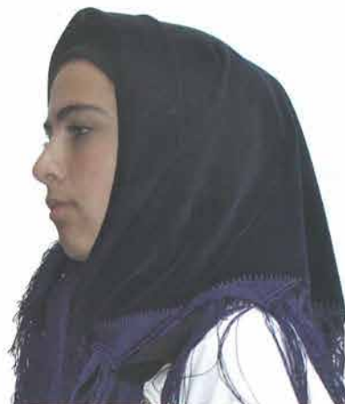
Mlada žena zavijena u plišanu zavijaču na podvezu s češljem, Grabarje

Starije žene su na poculicu zavijale rubac , ridu ili maramu zavijaču.