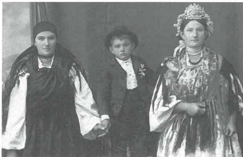
Mlada žena u podvezi s češljem i djevojka s vijencem, okolica Požege, početak 20.st.

se povezivala na smotanu kosu s umetkom i kao gornje pokrivalo stavljale tibetnu 72 podvezu .