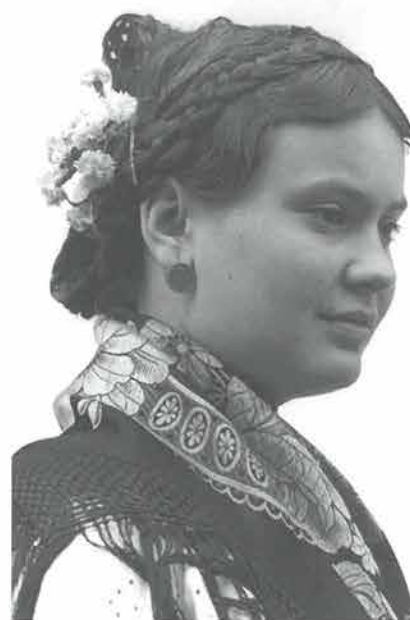
Djevojka počešljana u perčin s kintošima i coklinima , rekonstrukcija, 1974.

U vrijeme korizme i adventa djevojke su nedjeljom češljane u perčin , ali nisu ga kitile cvijećem. Na Veliki petak djevojke su išle u crkvu zavijene - povezane glave u crne marame.