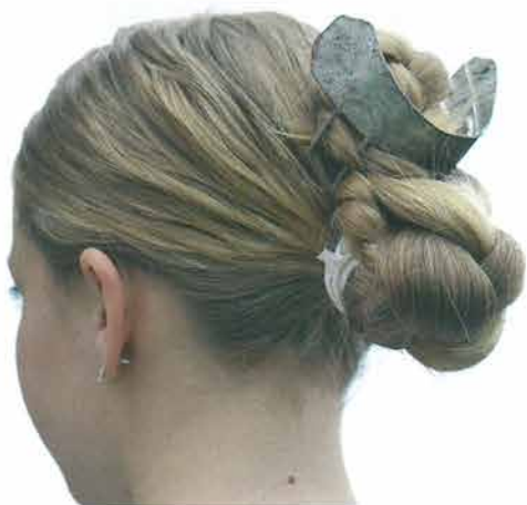
Pletenica s metalnim češljem, Bektež

četverostrana tibetna podveza ili šafolka koja se prije stavljanja na glavu presložila po dijagonali. Marama je prekrivala cijelu glavu. Prilikom vezivanja pazilo se da cvjetni ukras – „ruža“ u uglu marama dođe na sredinu češlja između „rogova“. Krajevi marama povezivali su se otraga na vratu i puštali da slobodno vise. Podveze na češalj početkom 20. stoljeća bile su veće, kao i podveze koje su dolazile na poculicu , da bi se između dva svjetska rata upotrebljavale podveze manjih dimenzija. Crnu glotenu