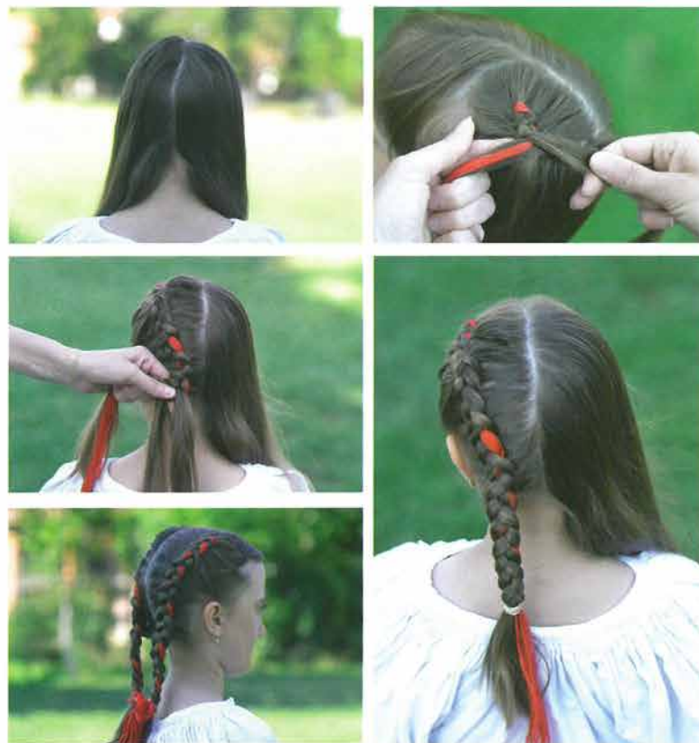
Rekonstrukcija izrade bilog luka

Djevojčicama su do njihove desete, dvanaeste godine pleli - splitali kosu u bili 15 ili bijeli 16 luk 17 - dvije pletenice spletene od tri struke - plesma 18 ili prama . Pri izradi frizure kosa se najprije če-