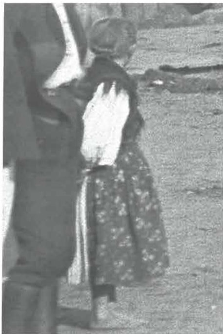
Djevojčica počešljana u bili luk , Dolac, oko 1910.

visini ušiju. 20 Ponegdje 21 u svečanim prilikama bili luk bi se ponekad ukrašavao cvijećem.