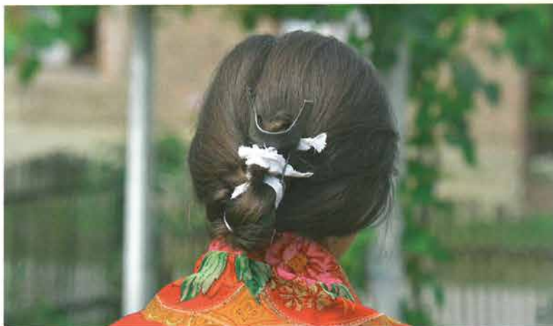
Pletenica s metalnim češljem, Bankovci

četverostrana tibetna podveza ili šafolka koja se prije stavljanja na glavu presložila po dijagonali. Marama je prekrivala cijelu glavu. Prilikom vezivanja pazilo se da cvjetni ukras – „ruža“ u uglu marama dođe na sredinu češlja između „rogova“. Krajevi marama povezivali su se otraga na vratu i puštali da slobodno vise. Podveze na češalj početkom 20. stoljeća bile su veće, kao i podveze koje su dolazile na poculicu , da bi se između dva svjetska rata upotrebljavale podveze manjih dimenzija. Crnu glotenu