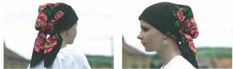
Glava mlade žene povezana šafolkom na češalj, Bektež

maramu kao podvezu povezivale su u razdobljima žalovanja, a nosile su je i stare žene.