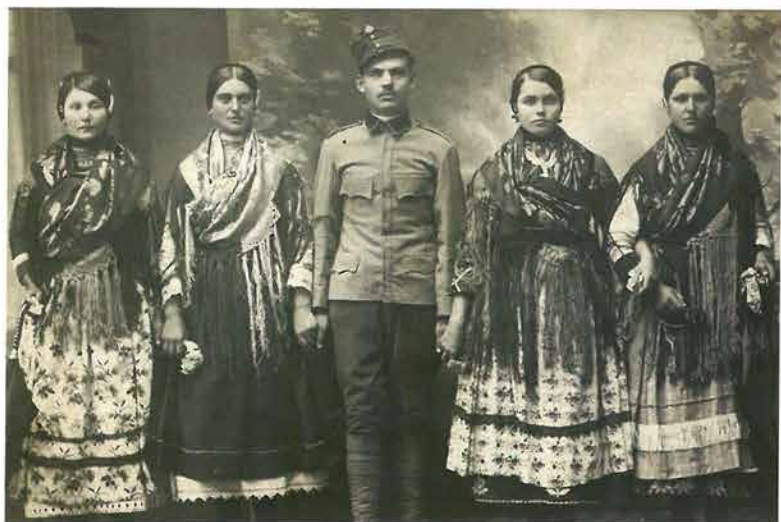
Djevojke iz Kutjeva počešljane u grethen, 1914-1918.