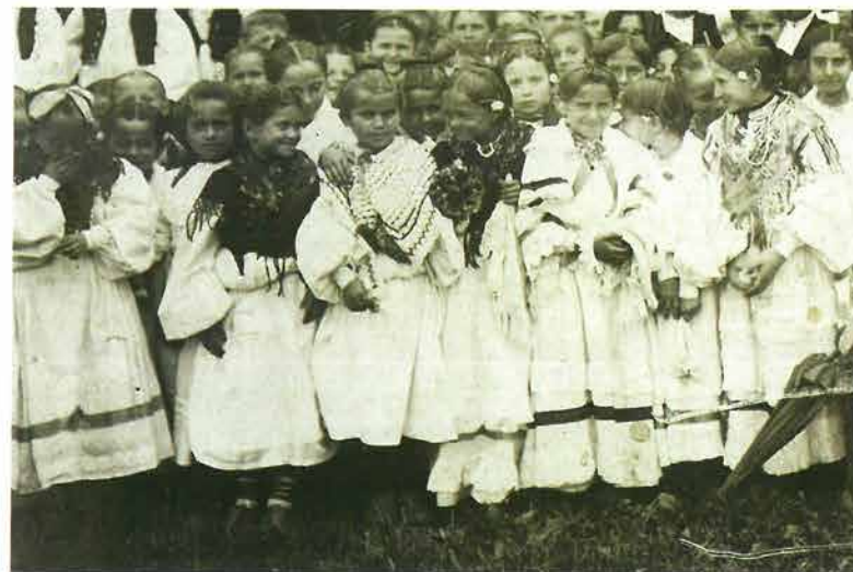
Djevojčice iz okolice Požege, Požega, 1907.

šljala na razdjeljak sredinom glave i odijelila na dva kraja. Pletenice su se plele od sljepočnica uz glavu prema leđima. Prema potrebi, prilikom prepletanja uplitali bi se dodatni pramenovi sa strane. Kod djevojčica koje su imale kraću kosu, ispletene pletenice su se povezivale zajedno na leđima vrpcom – pantljičicom ili crvenom pređicom. Postojale su dvije varijante pletenja bilog luka , jedna je bila da se pletenice kod vrata spoje u jednu pletenicu, 19 a druga je bila da se pletenice prekrize i podignu na zatiljak, te učvrste u