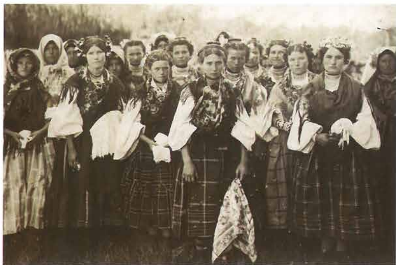
Skupina djevojaka počešljanih u perčin , Požeška kotlina, oko 1910.

Analizirajući fotografije iz prva dva desetljeća 20. stoljeća, primjećuju se raznovrsne frizure češljanja u perčin . Čeoni dio kose u pravilu je bio podijeljen razdjelkom po sredini, ali s raznovrsnim varijantama začešljanja i oblikovanja kose: glatko začešljana sa strane preko ušiju ili iznad ušiju, polukružno začešljana na čelu tipa coklina , ili začešljano prema gore, ili s uvojcima, ili coklinima u obliku roščića zvani rogovi . Prema sjećanjima Ive Čakalića 32 iz Doljanovaca kosu su češljali naprijed „nad čelom kao nike cokle il kako su rekli rogove izvući“, što potvrđuje fotografija triju djevojaka iz Stražemana koje su naprijed počešljane u male roščiće. Također su raznovrsne bile kombinacije perčina s manjim pletenicama pletenim sa strane: kintoši ili vitice 33 prebacuju se preko tjemena u jedan, dva reda ili se dolje sastavljaju s perčinom , pletenice pletene od četiri struke poput rešetke u donjem dijelu do perčina , uvrnuta kosa sa strane iznad ušiju ili samo glatko začešljana. Osim prirodnim ili umjetnim cvijećem, glave su kitili i raznim španjicima i metalnim ukrasima poput malih zvečki.