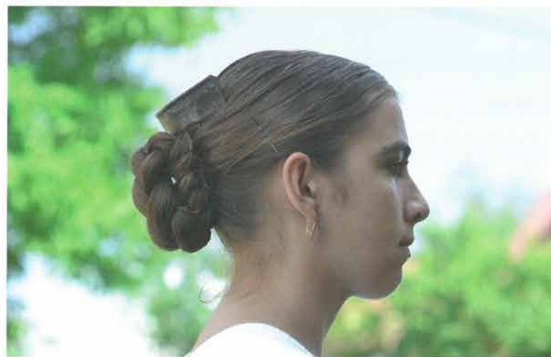
Pletenica s metalnim češljem, Grabarje

uz glavu, za razliku od ostalih sela Požeštine. Preko češlja povezivala se jaglučna kapica – poculička (Vetovo) ili kapica od kupovnog platna, a kasnije su koristili prostiju podvezu ili neku manju maramu (Bektež, Vetovo). Na to se povezivala šarena