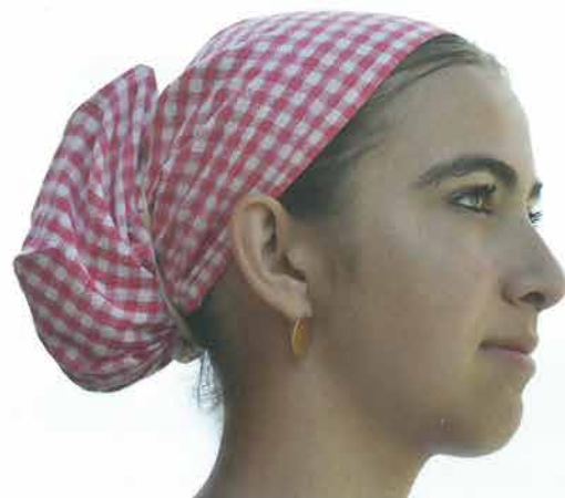
Pletenica i češalj povezani kapom, Grabarje