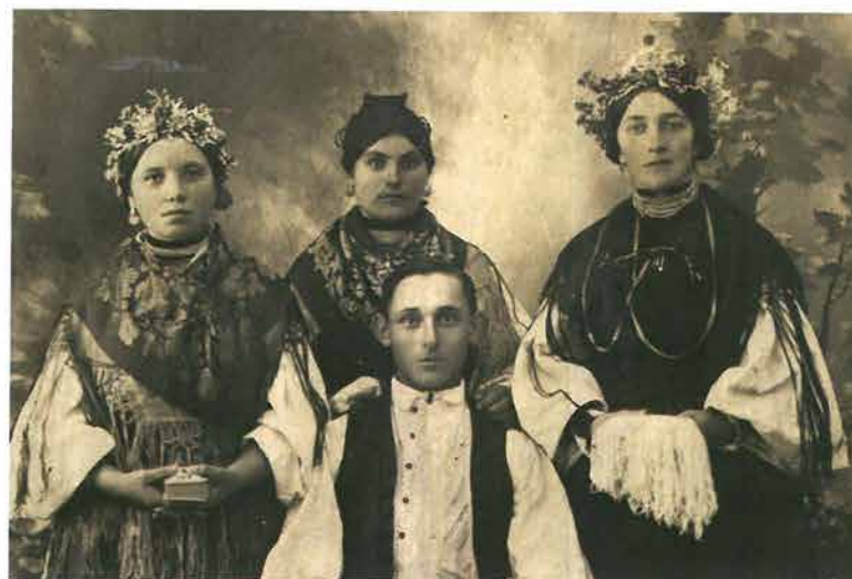
Dvije djevojke s vijencima iz Štitnjaka, 1910-1918.

Svadbene vijenci ili krune simbol su prijelaza djevojke u stalež udanih žena. Kosa i glava mladenke središte je magijskih postupaka i značenja. Crvena boja, 41 razni sjajni, trepera-