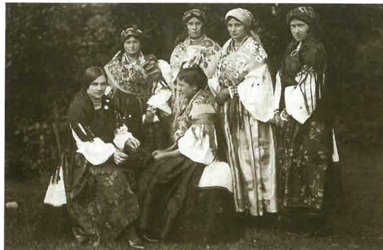
Mlade snaše u poculicama s podvezama , Velika, prije 1910.

lja . Mlade snaše su ispod podveze pričvrstile roce – spletene u četiri ili više struka poput nanizane pletenice u obliku rešetke ili poput čipke od crne konjske strune. 64