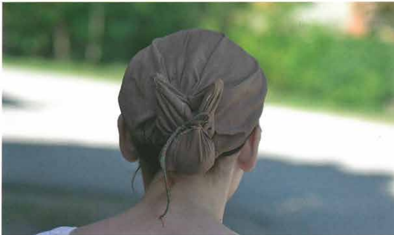
Pletenica i češalj povezani poculičkom, Vetovo