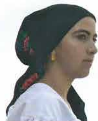
Glava mlade žene povezana podvezom na češalj, Grabarje