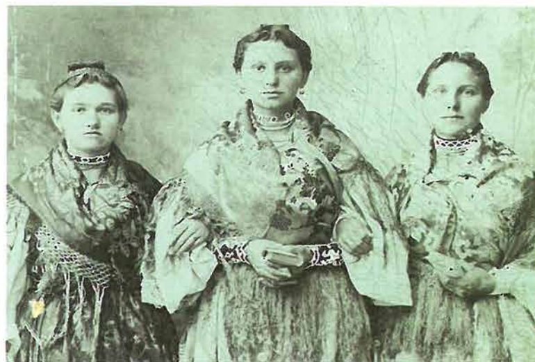
Tri djevojke iz Stražemana počešljane u perčin s rogovima , Požega, oko 1915.