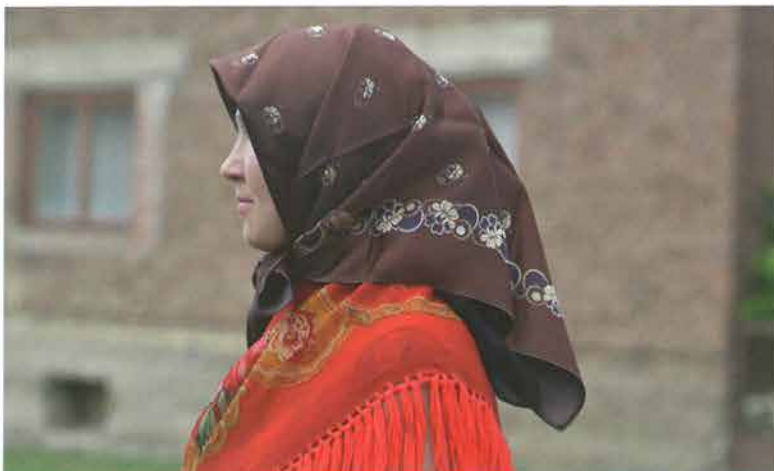
Žena zavijena u zavijaču na podvezu s češljem, Bankovci

Mlade snaše počešljane u podveze nisu se bogato kitile kao snaše u poculici . Podveza se mogla nositi sama, bez zavijače s patkovim kofrčkom popodne u nedjelju, na blagdane, na večernju misu. Na veliku jutarnju misu išlo se uvijek „zavito“.