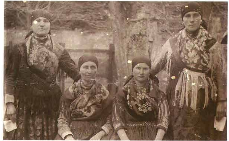
Mlade žene iz Kutjeva povezane u češalj sa šafolkom , 20-e god. 20.st.

U Kutjevu i Bektežu ne pamte da su udane žene nosile vezene poculice , one su kosu češljale u češalj, kapicu ili maramu, te povezivale šafolku ili šamiju . 70 Naziv poculica koristili su za donju bijelu kapicu povezivanu na češalj.