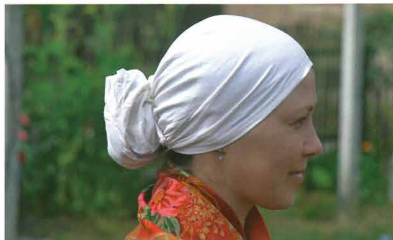
Pletenica i češalj povezani kapom, Bankovci