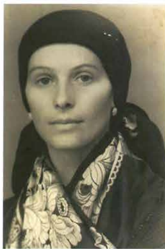
Mlada žena u podvezi s češljem, okolica Požege, 30-e god. 20.st.

Udane žene plele su kosu na potiljku u jednu pletenicu od tri struke koju su presložile okomito ili omotala u tutuk ili kotur povrh kojeg su zabole metalni savinuti češalj s dugim zubcima. U selima oko Požege češljevi su bili manji, užji, čiji krajevi su išli više u „rog“, dok su u Bektežu i Kutjevu bili veći i više polukružni s manjim „rogovima“ sa strane. U kutjevačkom kraju su ih stavljali više