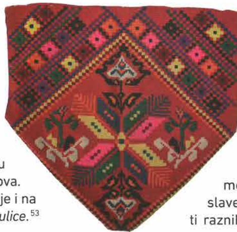
Poculica iz požeškog kraja, Gradski muzej Požega

Na ovim kapicama javljaju se raznovrsni motivi na kojima su prisutni razni utjecaji (staroslavenska, orijentalna, europska) i kulturni elementi raznih razdoblja (prapovijest, antika, barok). Česti su geometrijski likovi rombova većih i manjih, jedan unutar drugoga, manjih rombova među-