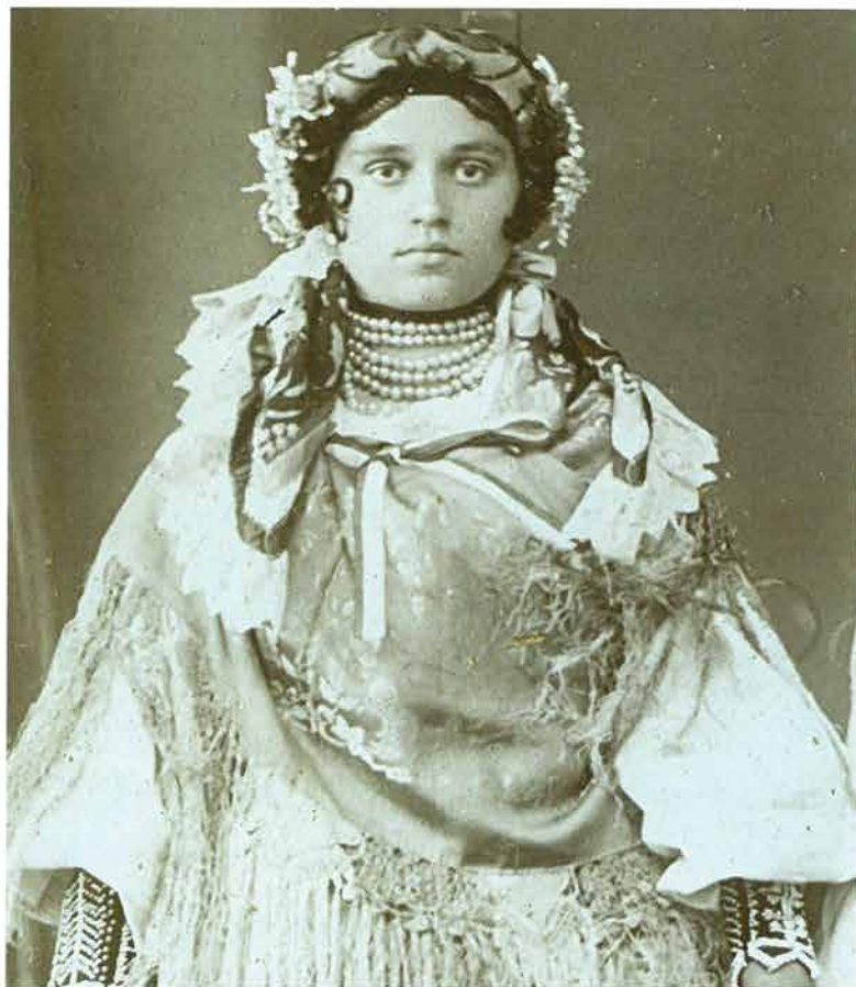
Mlada snaša iz Zakorenja okičena s rocama ispod podveze , Požega, oko 1915.

Na poculicu, nad čelom, povezivala se marama zvana podveza od kupovnog štofenog materijala sa cvjetnim motivima – šafolka , ili svilena marama od tanke svile često s dodanim resama ili kupovnom čipkom 63 uokolo krajeva marame. Starije žene i one koje su se rušile , koristile su crnu glotenu maramu, a u najvećoj rušnji kao podvezu su koristili bijeli laneni domaći rubac. Podveza se slagala u trokut i premotavala u traku u koju se dodao čvršći komad pravokutnog papira kako bi se oblikovao špic nad čelom. Krajevi marame vezivali su se ispod ovr-