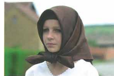
Mlada žena zavijena u voštikl, Bektež