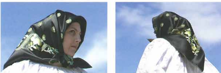
Žena zavijena u zavijaču svilenku na podvezu s češljem, Vetovo

Marama zavijače bili su rupci od domaćeg tkanja i svaka marama koja se zavijala ili pokrivala glavu, a dolazila je povrh poculice ili podveze sa češljem . Krajevi marama vezali su se pod bradom ili „po starinski“ bi se prekrížili pod bradom i povezali na zatiljku. Stariji tip zavijače nazivao se rubac ili rida . 75 To je bila marama od domaćeg bijelog tkanja više četvrtastog oblika, koja se preslože-