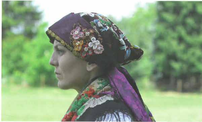
Rekonstrukcija zlatne čipke i drtalica na podvezi, Biškupci

Uspoređujući ove poculice s pakračkim poculicama , 67 koje su po svom šiljatom kroju najbližije požeškim, a na čeonom dijelu imaju našivenu crvenu čohu zvanu riza s pričvršćenom kukičanom čipkom pod imenom širint , nameće se pitanje pripada li ovaj tip poculice starijem sloju kapica koji je u požeškom kraju preslojen prema kraju 19. stoljeća u varijantu poculice bez čipke. Poculica sa zlatnjakom iz Velike može se okvirno datirati oko 70-ih godina 19. stoljeća. Stjepan Marjanović 68 1853. godine spominje da su se u okolici Nove Gradiške i Slavenskog Broda nosile počelice sprijeda ukrašene crvenom čohom. Poculice iz Staroga Petrovog Sela (novogradiški kraj), koje se čuvaju u Etnografskom muzeju u Zagrebu, na čeonom dijelu imaju prišivenu crvenu čohu sa zlatnom ili bijelom čipkom. Za razliku od pakračkih i požeških, ove poculice krojene su više kružno od dva komada vezenog platna s umetnutim užim pravokutnim, vezenim ili čipkanim spojem. Poculica se kao starije pokrivalo za glavu u ovim krajevima prestala nositi krajem 19. stoljeća. Ovo svakako zahtijeva daljnja istraživanja za novim