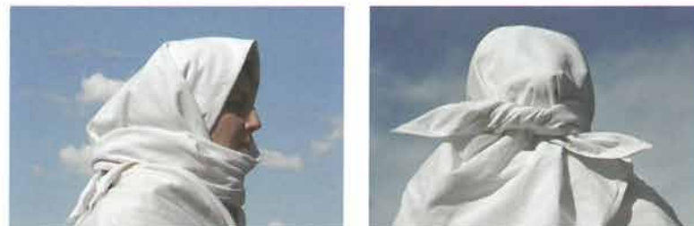
Žena zavijena rupcem u velikoj rušnji, Vetovo

na po dijagonali stavljala na glavu preko poculice , ali i podveze s češljem . Bila je tkana od uzorkovanog platna s različitim bijelim ručnim radom ili bez njega. „Čisti“ bijeli rupci otkani od lanenog platna bez ukrasa nošeni su u žalosti – rušnji . U posljednjem desetljeću 19. stoljeća mlade žene domaće rupce zamjenjuju kupovnim maramama od svile, vune i pamuka. Bijeli domaći rupci zavijali su se samo u rušnji do polovice 20. stoljeća. U velikoj rušnji zavijani su veliki rupci „po starinski“, a u manjoj rušnji manji pod bradom. Tijekom prve polovice 20. stoljeća zavijane su u manjoj rušnji , poslije rubaca , tamno plave ili crne pamučne kupovne marama zvane farbarice sa sitnim, najčešće bijelim uzorkom uokolo ruba. Farbarice su bile i zavijače za stare žene, a postupno su zamijenile bijele rupce u rušnoj nošnji. U Kutjevu i Bektežu farbarice povezivane ispod brade nošene su u svima fazama žalovanja.