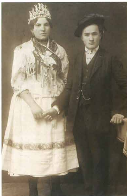
Mladenka iz Šeovaca, Bankovci, Požega, oko 1925.

Poculica kao stariji tip vanjskog pokrivala nošena je na prostoru cijele zapadne Slavonije i šire. U drugoj polovici 19. stoljeća spominju ih pisci Stjepan Marjanović 45 i Mijat Stojanović 46 na području okolice Slavnskog Broda i Nove Gradiške, odnosno području Vojne granice Slavonije i Srijema pod imenom počelica i pocelica . Raznolike kapice, poculice , pocelice , pocalice koje se razlikuju po svojim oblicima i kroju nošene su na cijelom području sjeverozapadne i istočne Hrvatske. U pojedinim dijelovima Bosne, kod katoličkog stanovništva, nošene su vezene kapice pod nazivima počelica , počelica , čepelica , poculica . 47 U Mađarskoj Hrvati su nosili ukrašene kapice i pocelice .