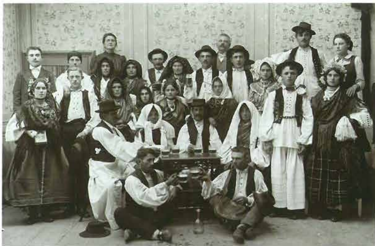
Požeška narodna nošnja, Požega, oko 1907.

pripadao Pauriji, odnosno Banskoj, civilnoj Hrvatskoj, dok je mali dio južno od Orljave bio u sklopu Vojne krajine – granice. 8 Prema smještaju sela stanovnici se dijele na one u Poljadiji (nizinski dio) i u Podplanini (prigorski dio Papuka i Krndije).