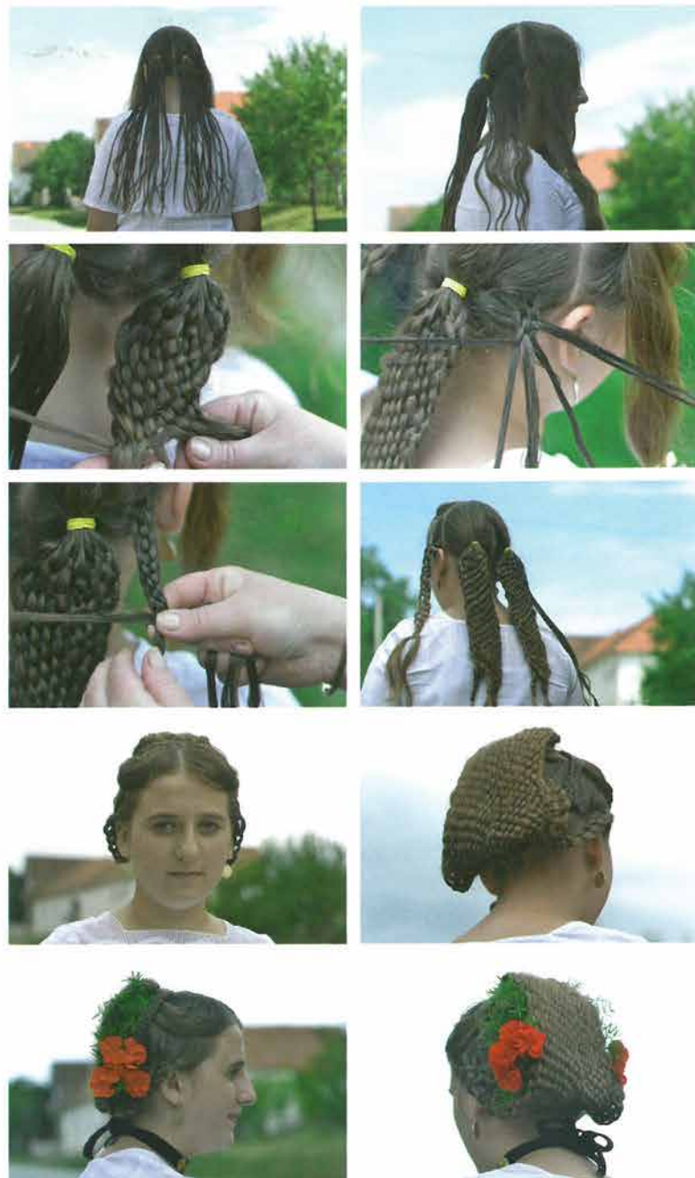
Rekonstrukcija izrade perčina s coklinima , kintošima i rešetkastim pletenicama