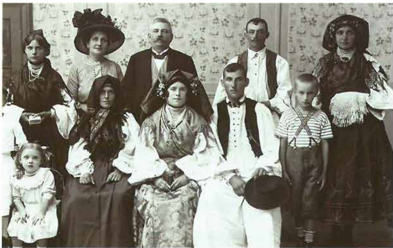
Mlada žena iz Bankovaca sa svečano ukrašenom zavijačom na poculicu, Požega, 1907-1910.

marame slobodno su padali niz prsa, a strane su kitili smiljem ili cvjetnom granom. Takve marame djevojke su u svečanim prilikama nosile oko vrata. Početkom 20. stoljeća djevojke su na prvoj večeri iza zaruka, zvanj „kućni Prsten“, dobivale baj-oder od obitelji budućega muža. 77