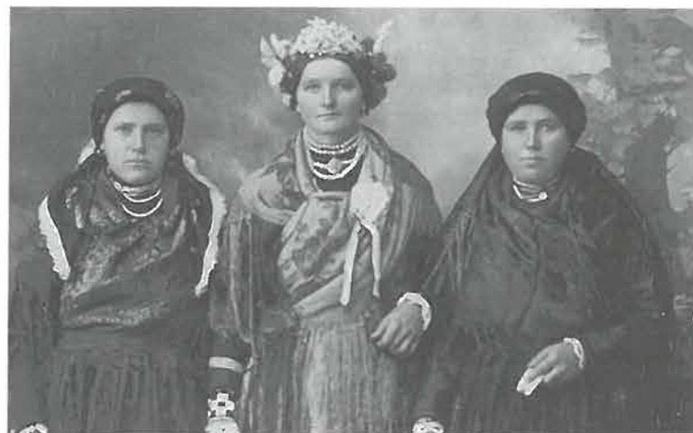
Djevojka s vijencem i dvije mlade žene u poculicama s podvezama iz Bankovaca, Požega, 1910-1918.

Svadbene vijenci ili krune simbol su prijelaza djevojke u stalež udanih žena. Kosa i glava mladenke središte je magijskih postupaka i značenja. Crvena boja, 41 razni sjajni, trepera-