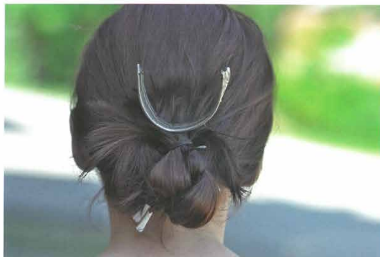
Pletenica s metalnim češljem, Vetovo