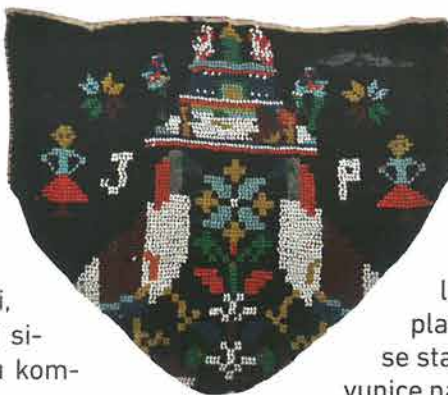
Poculica iz Trenkova, Gradski muzej Požege

sobno spojenih, rombova spojenih u mrežu, zatim kvadrata, zvijezda, rozeta i križeva. Likovi rombova 59 i kvadrata česti su na starijim poculicama , ali se javljaju i na mlađima, pogotovo na staračkim i rušnim poculicama . Najčešći su biljni motivi poput raznih grančica, vitica, vjenčića, cvjetova, cvjetnih grančica koje izviru iz kantarosa. Od zoomorfnih motiva zastupljene su ptice, patkice, jeleni, psi, pijetlovi 60 postavljeni kao samostalni likovi ili simetrično postavljeni na način zrcalne slike u kombinaciji s ostalim motivima, poput životnog stabla. Često su na poculicama izvezeni inicijali imena vlasnica ili puno ime, te godina izrade. Posebnost požeških poculica čine arhitektonski prikazi dvoraca, crkvi i kuća, te antropomorfnih prikazi ženskih likova u podbočenom stavu. Boje podloga poculica bile su crvena, crna, smeđa, ljubičasta, ružičasta, zelena, modra i bijela.