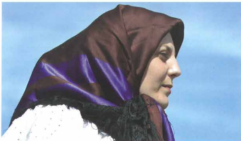
Žena zavijena svilenkom na poculicu, Vetovo

marame slobodno su padali niz prsa, a strane su kitili smiljem ili cvjetnom granom. Takve marame djevojke su u svečanim prilikama nosile oko vrata. Početkom 20. stoljeća djevojke su na prvoj večeri iza zaruka, zvanj „kućni Prsten“, dobivale baj-oder od obitelji budućega muža. 77