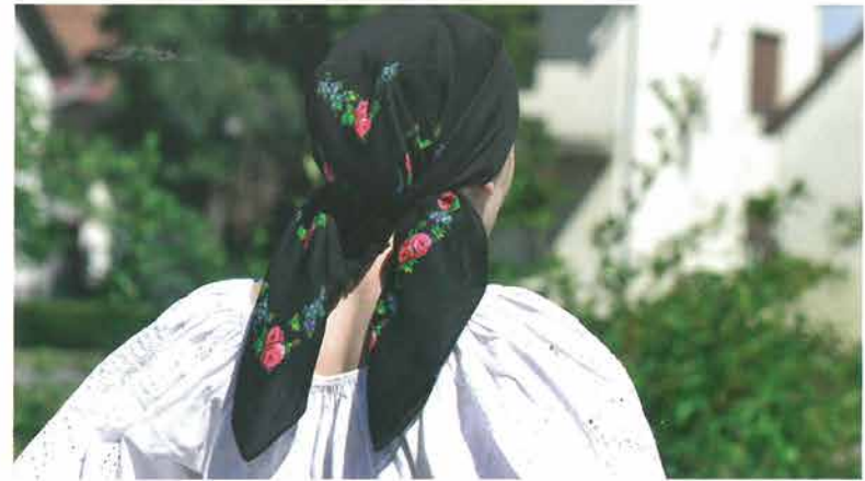
Glava žene povezane podvezom na češalj, Vetovo