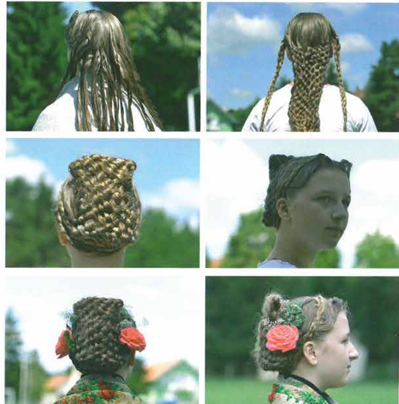
Rekonstrukcija izrade perčina s kintošima | rogovima

Kosa se tijekom izrade perčina namakala smjesom vode i šećera – „da perčin bude malo ukočit“, to jest da kosa bude čvrsta ili se mastila mašćom da se bolje razdvoji i isplete. Zatim se razdijelila na četvero, to jest podijelila se na putak – razdjeljak sredinom glave i potom poprečnom stazom od uha do uha preko tjemena. Sa svake strane glave ostavio se dio kose za izradu coklina i kintoša . Perčin se pleo u cjelovitu pletenicu od krajnjih struka – plesama prema sredini, a broj struka ovisio je o bujnosti kose, mogao se plesti do 41 plesma . Ispletena pletenica se presavila i podigla prema tjemenu tako da malo