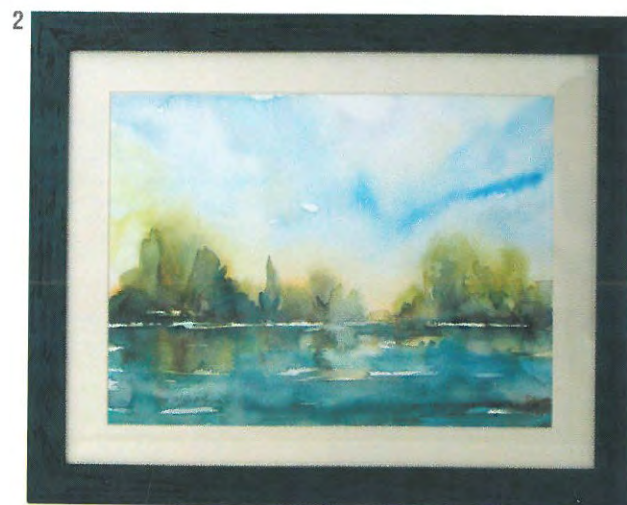
2. Krajoblik u plavom, akvarel, 38 x 51 cm (GMP 10.004)