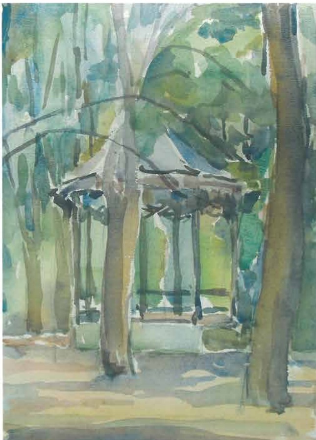
Paviljon, Zagreb, 1943.