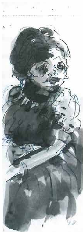
Gospoda sjedi u nabranoj haljini, 1998.