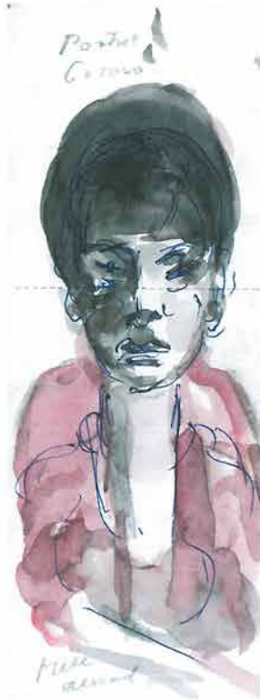
Žena u ružičastoj košulji, 1998. 21