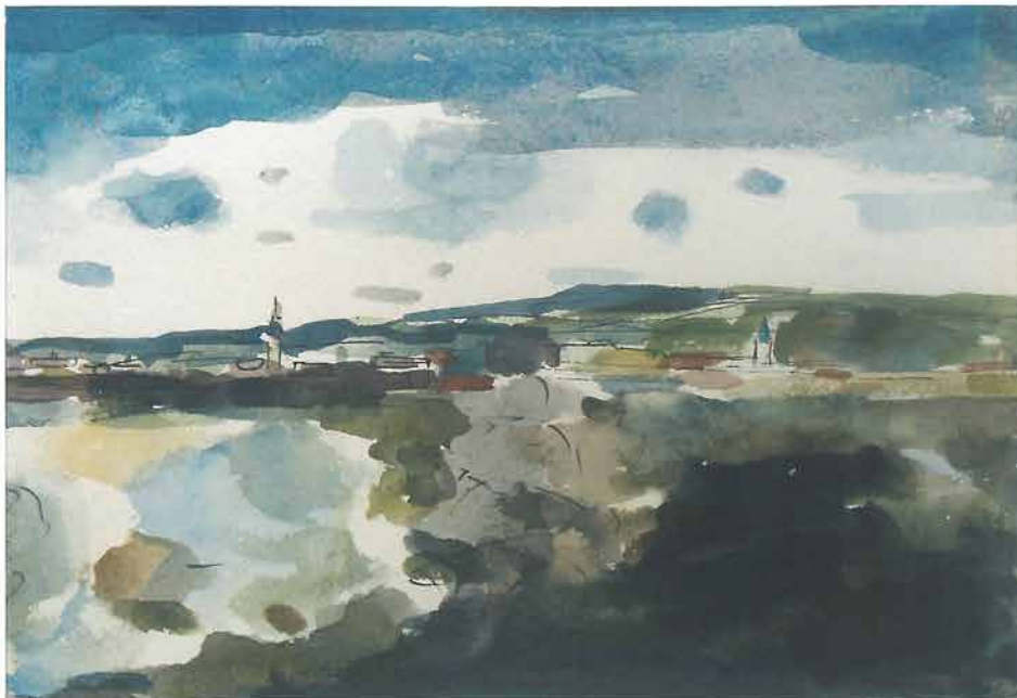
Plavo nebo iznad grada, 1961.