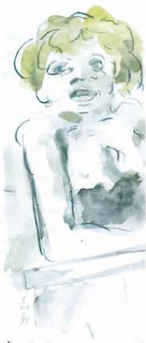
Žena plave kose