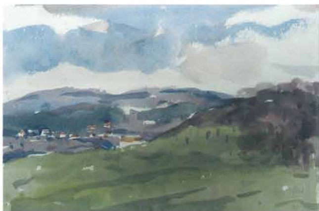
Prospekt iza zelene padine, 1966.