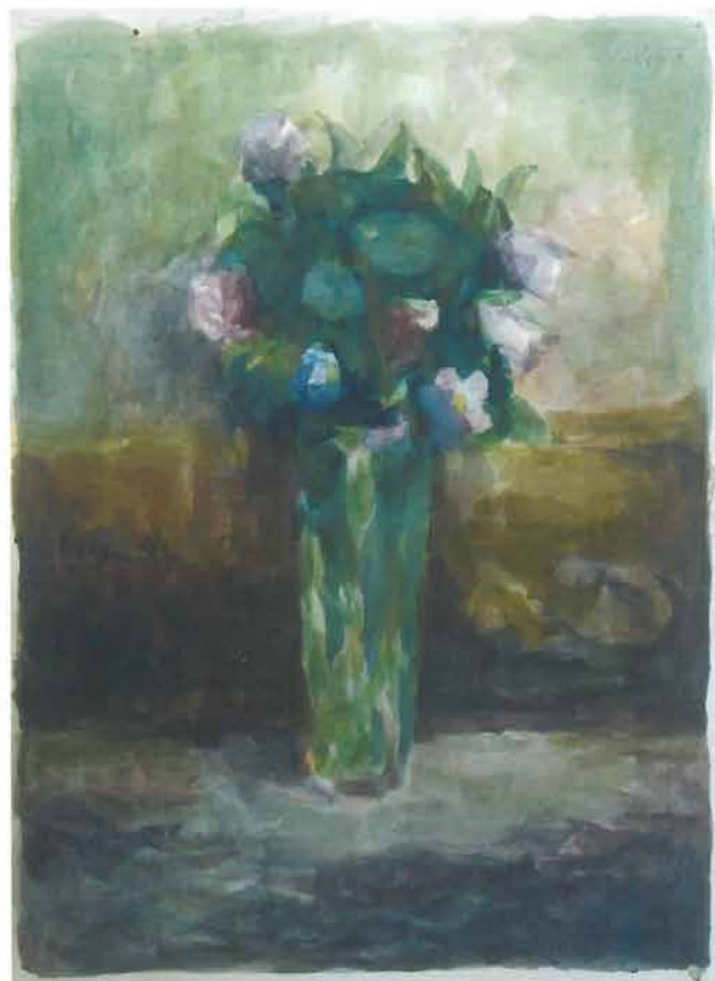
Buket u visokoj, zelenoj čaši, 1951.