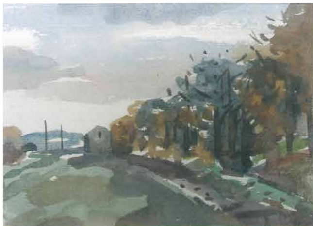
Cesta uz šumu s kućom, 1965.