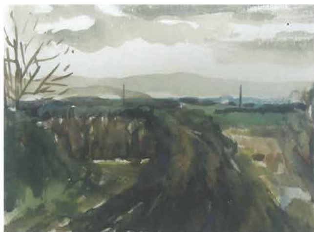
Smeda lenija, 1961.