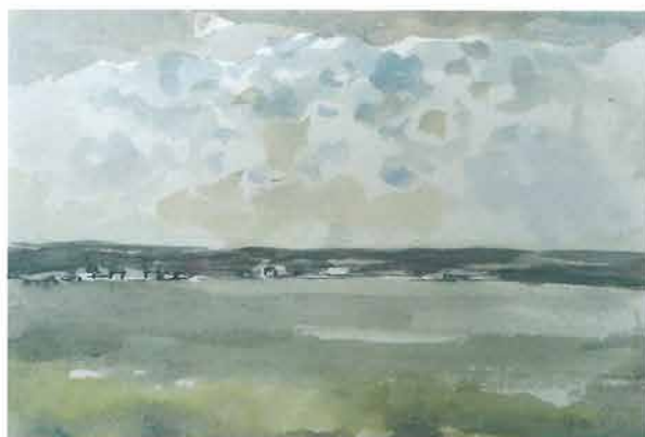
Ravnica sa smeđim bregovima na obzoru, 1957.