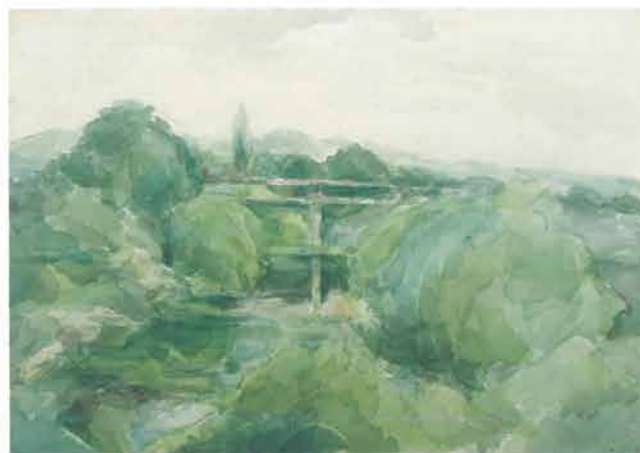
Drveni most na Orljavi, 1949.