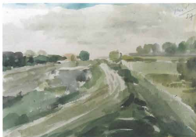
Zeleni seoski puteljak, 1957.