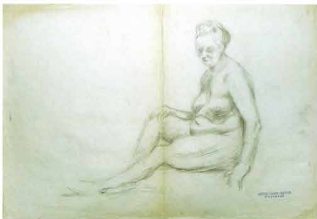
Stariji ženski akt sjedi na podu