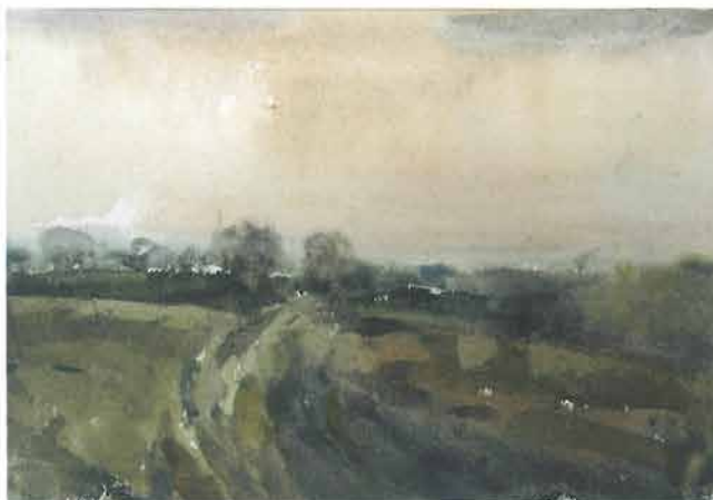
Jesensko polje, 1961.