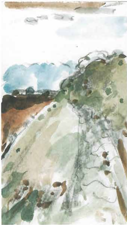
Sali na Dugom otoku; 09.1999.