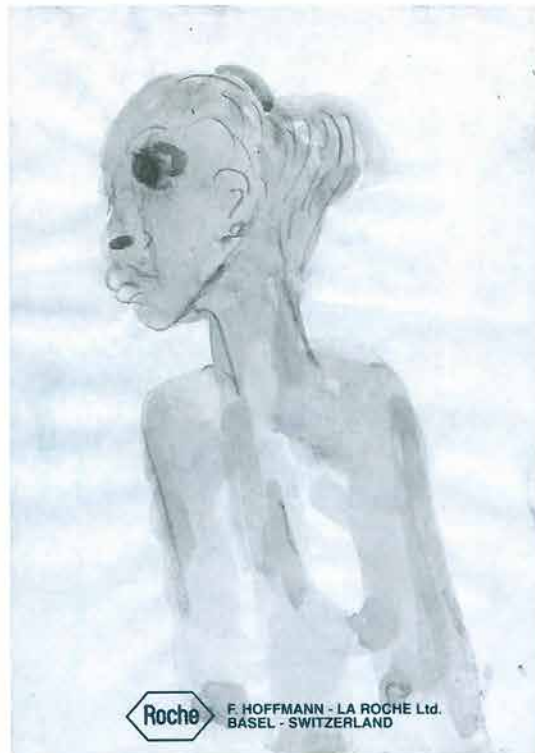
Crnkinja s dugim vratom i zategnutom kosom