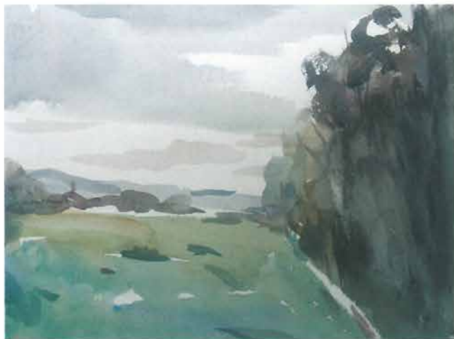
Zelena livada pod šumom