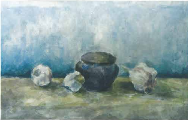
Mrtva priroda s češnjakom i pekmezom, 1951?