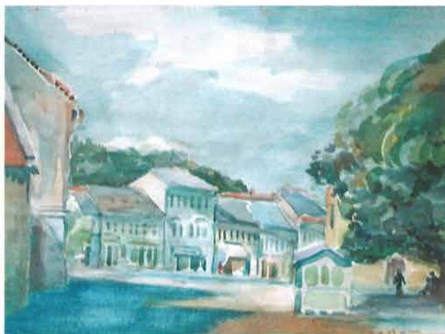
Požeški trg, 1941.