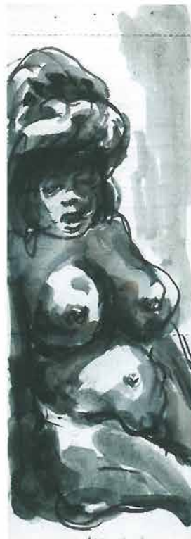
Akt žene koja sjedi 16