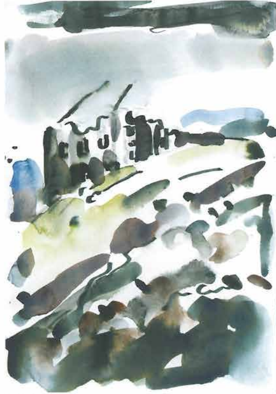
Sali pod oblacima