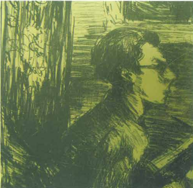
Autoportret u profilu, 1946.