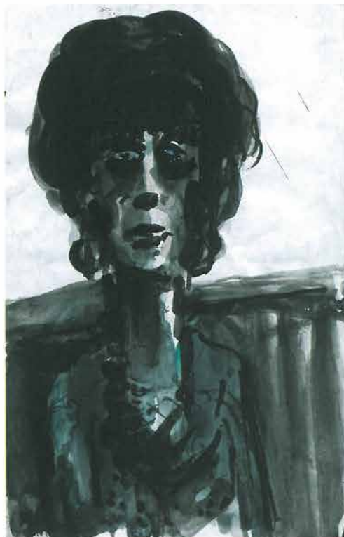
Žena u zelenkastojoj haljini i krupnim nakitom