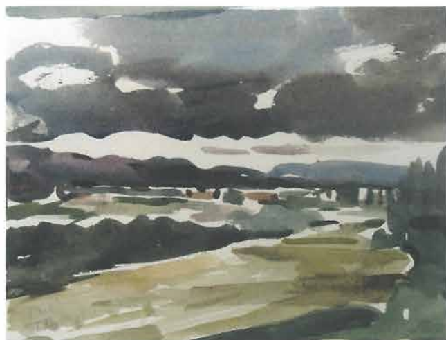
Tmurni pejzaž u desno, 1961.