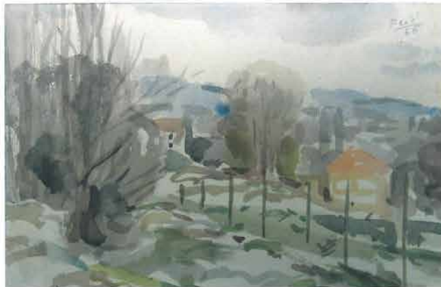
Svjetli proplanak s banderama, 1966.