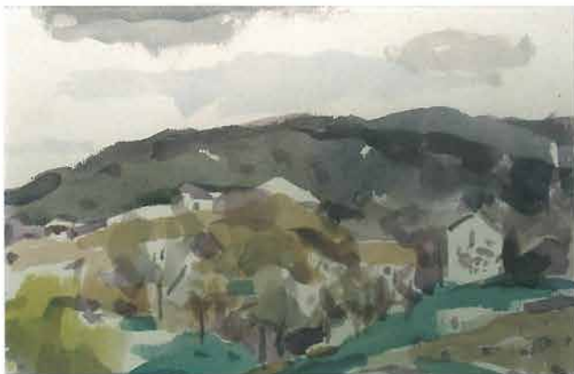
Ljubičasti pejzaž, 1966.