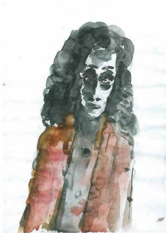
Žena duge kovrdave kose u smeđem kaputu