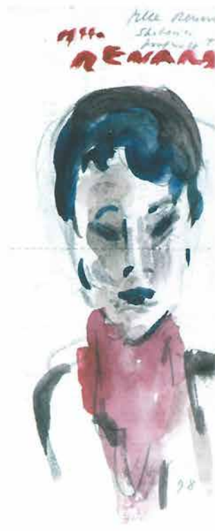
Žena s crvenom maramom, 1998. 22