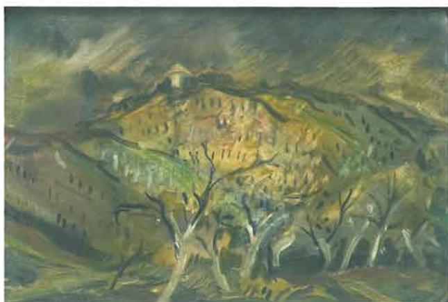
Vinograd s Thallerovom kolibom, 1947.