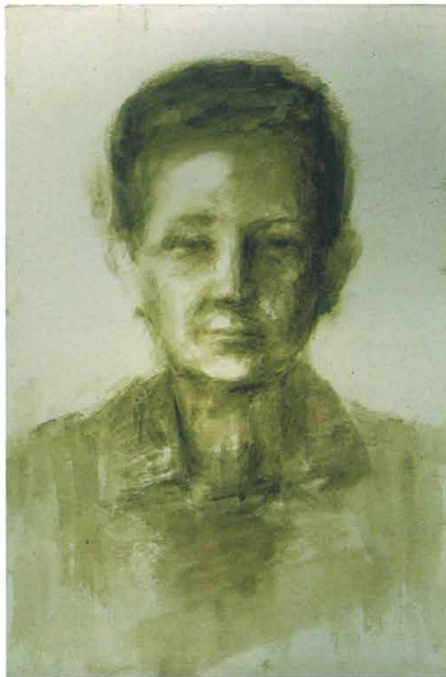
Moja mama, 1951.