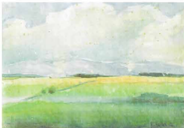
Požeška kotlina, 1941.

17. Lidija Ivančević Španiček: Žena u likovnom djelu Matka Peića, kritički osvrt na izložbu, Grad Požege, 11. ožujka 2009. god., rukopis