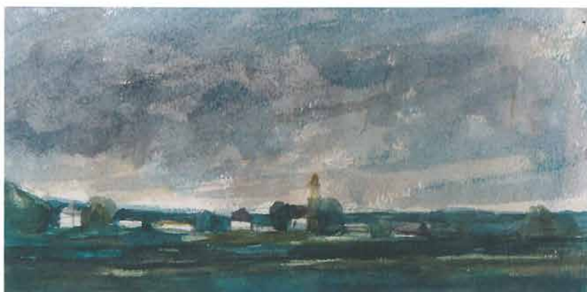
Ravničarski pejzaž s crkvicom, 1952.