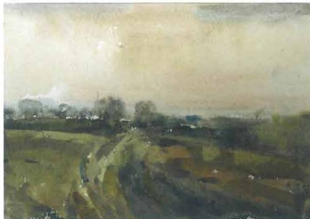
Jesensko polje, 1961.