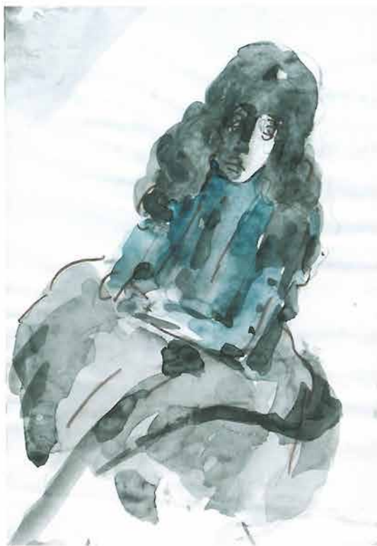
Žena koja sjedi u širokoj haljini, 1998.