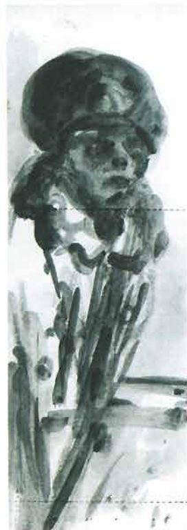
Žena s kapom odjevena u kaput