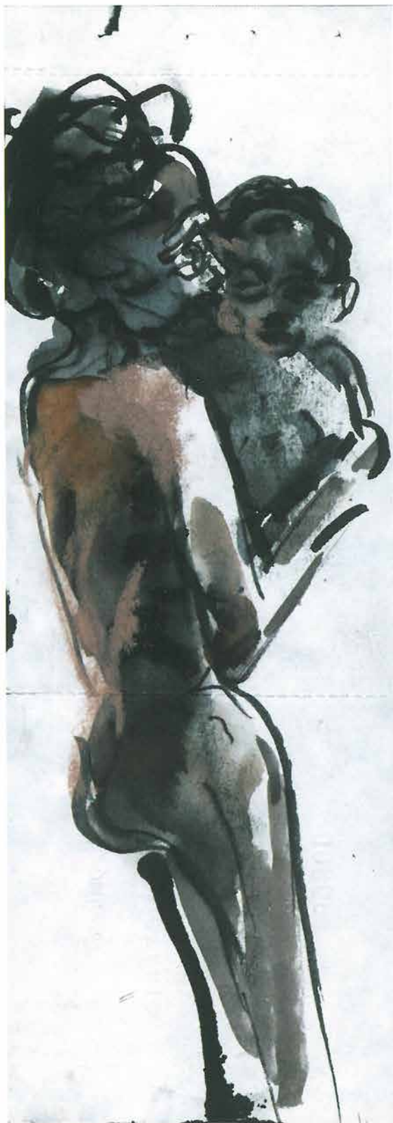
Žena s djetetom u naručju