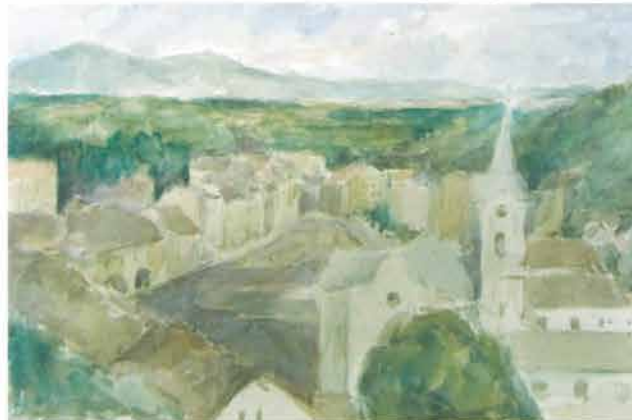
Pogled s Kalvarije, 1948.