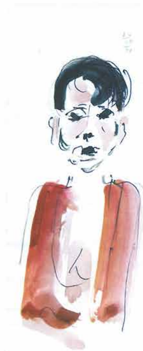
Žena kratke crne kose