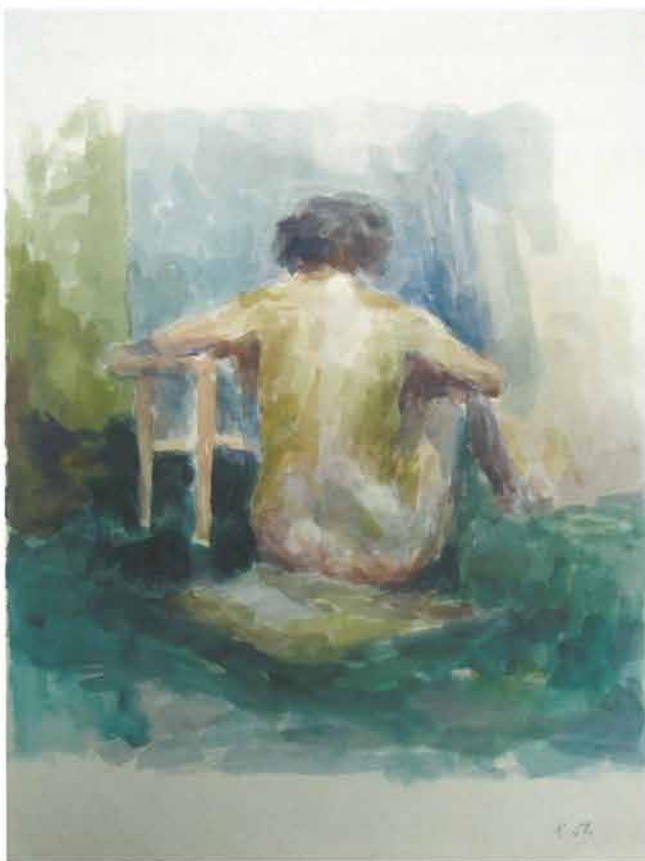
Akt s leđa sjedi na podu, 1951.

SLIKE IZ OSTAVŠTINE MATKA PEIĆA pohranjene u Državnom arhivu u Zagrebu