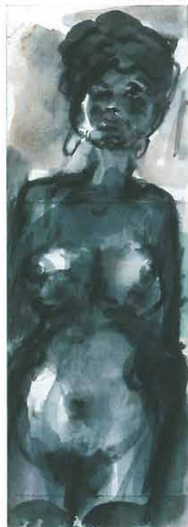
Akt žene s čarapama, 1998. 14