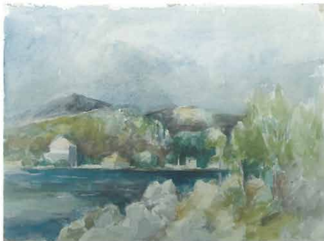
13 Marina s kućama u zaljevu, 1950.