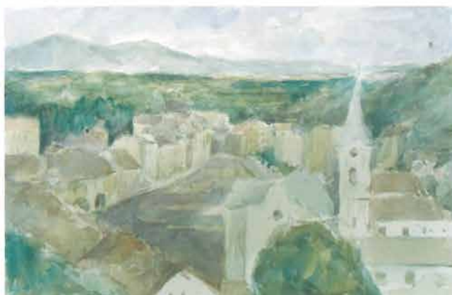
Pogled s Kalvarije, 1948.