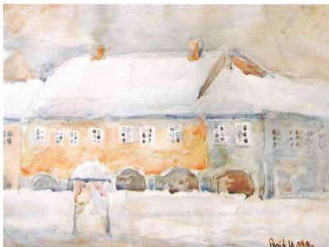
Požeški trg, 1940.