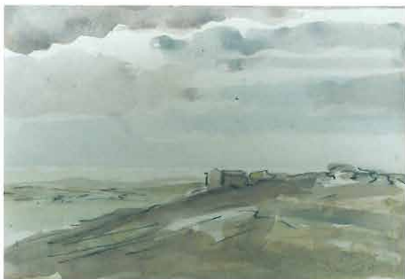
Smedkasti pejzaž, 1957.