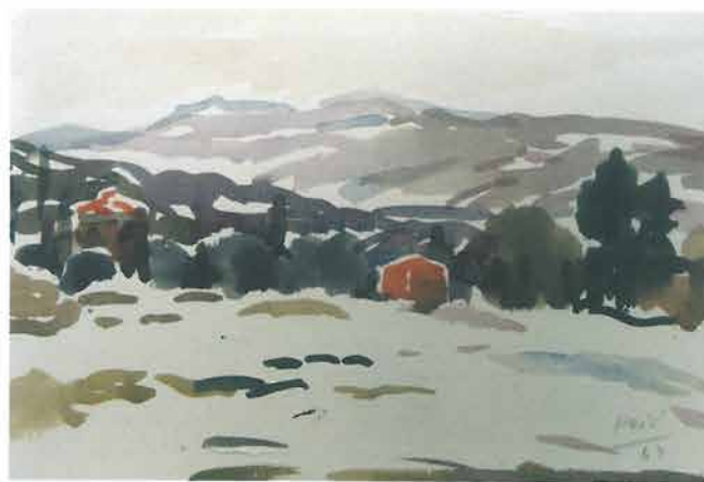
Pejzaž pod snijegom, 1964.