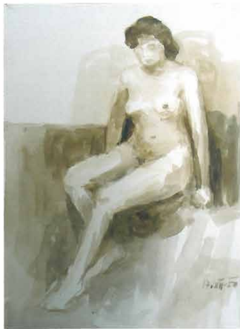
1 Akt sjedi u lijevom poluprofilu, 1950.