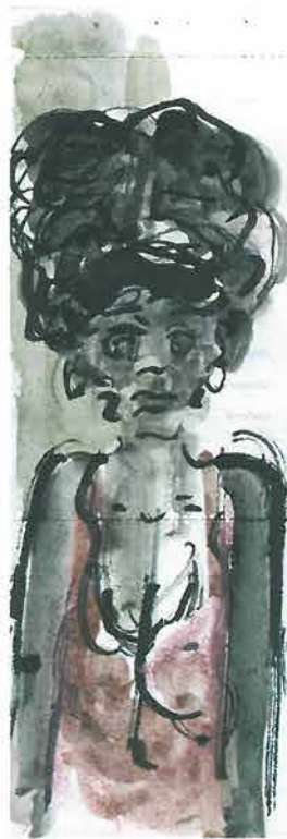
Žena u ružičastoj haljini, 1998. 19