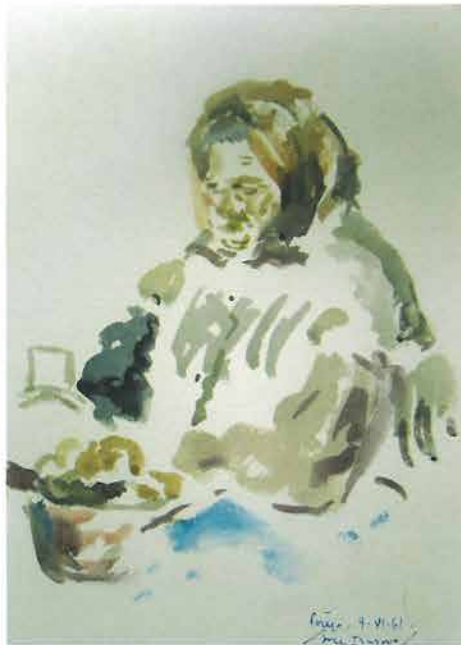
Moja Mama, 1961.