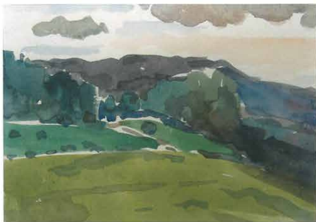
Zeleno - ljubičasti pejzaž, 1966.