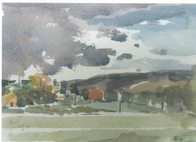
Pejzaž s banderama, 1962.