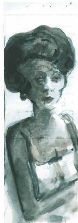
Gospoda s frizurom 18