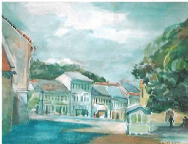
Požeški trg, 1940.