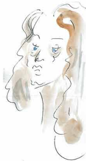
Žena smeđe valovite kose