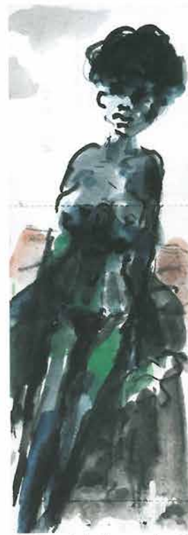
Akt žene s plavim čarapama i zelenom koprenom, 1998.