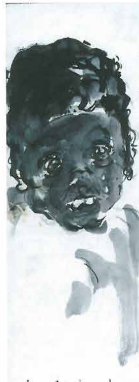
Portret crnčića, 1998.