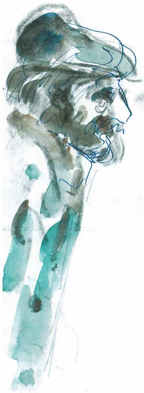
Čovjek u zelenom