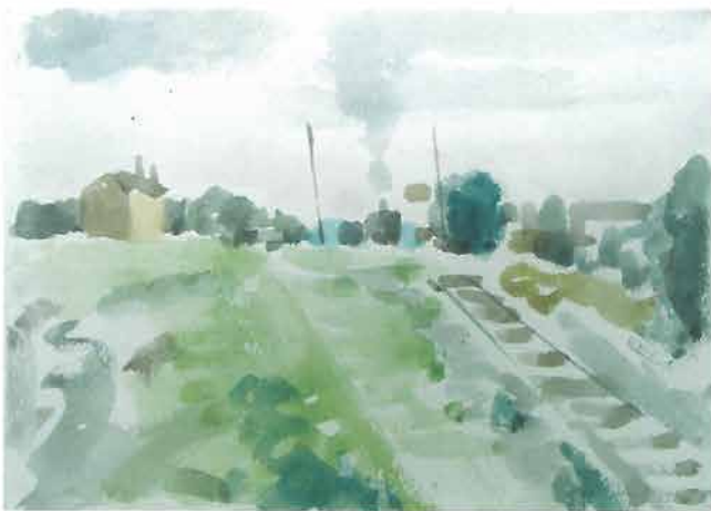
Požeški kolodvor ljeti, 1958.