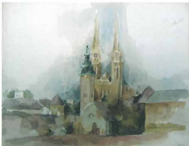
Zagrebačka katedrala, 1949.