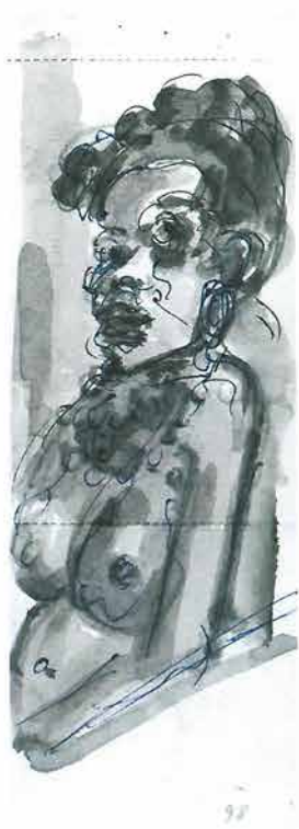
Crnkinja sjedi, 1998.