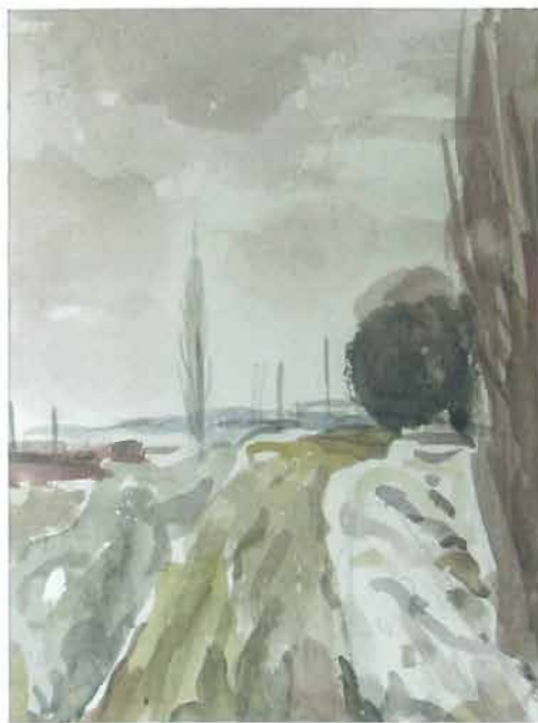
Smeđi jablani, 1965.