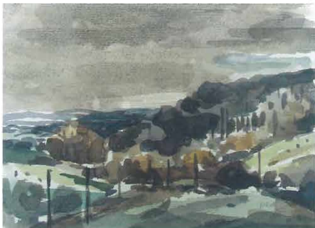
Smede nebo iznad kotline, 1965.