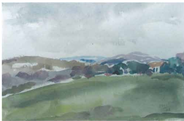
Bregoviti pejzaž, 1966.