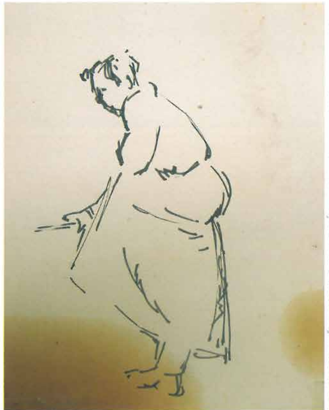
Figura Becića u profilu lijevo, 1941.