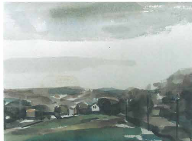
Panorama s nizom bandera desno, 1965.