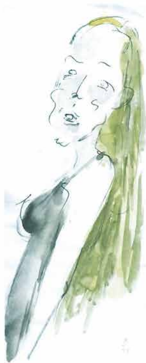
Žena duge plave kose