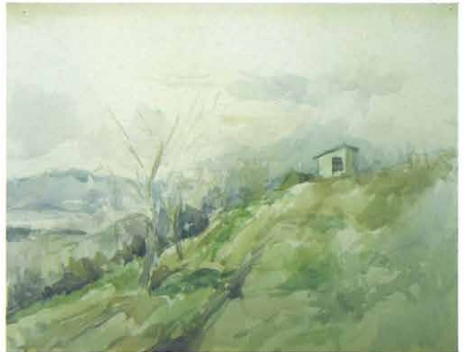
Klet na padini brijega, 1949.