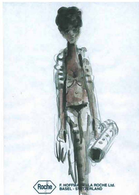
Odlazak s plaže, 1998.