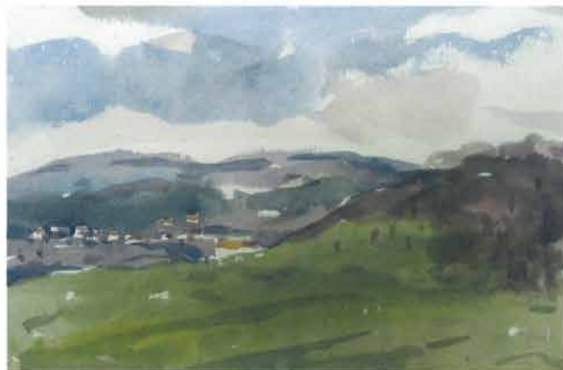
Prospekt iza zelene padine, 1966.

U uzajamnom razumijevanju Ljubo Babić i Matko Peić jednako su talentirano vladali umjetničkim kistom i perom, a to je vjerojatno bio razlog kako je Ljubo Babić znao prepoznati Peićevu osobitost: slikanje