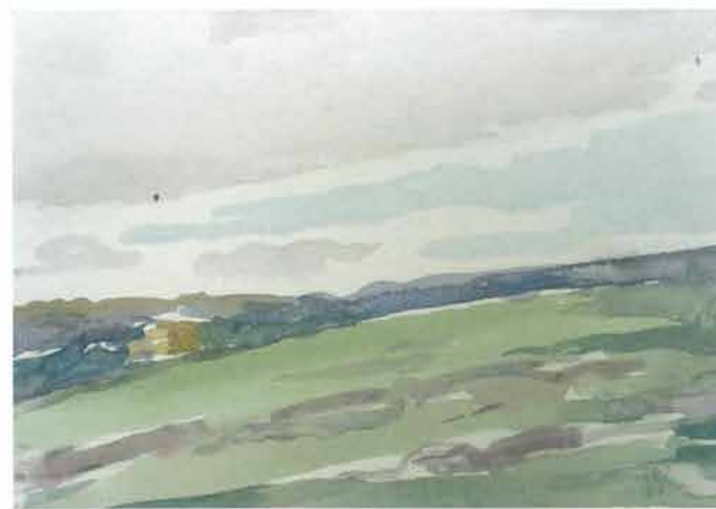
Svjetlozelena padina, 1966.