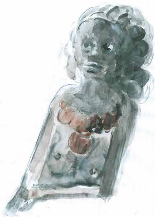
Crnkinja sa smeđom ogrlicom