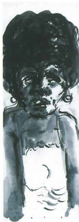
Žena u haljini s naramenicama