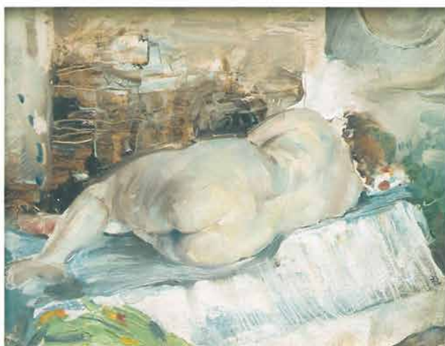
Akt žene, Zagreb, 1971.