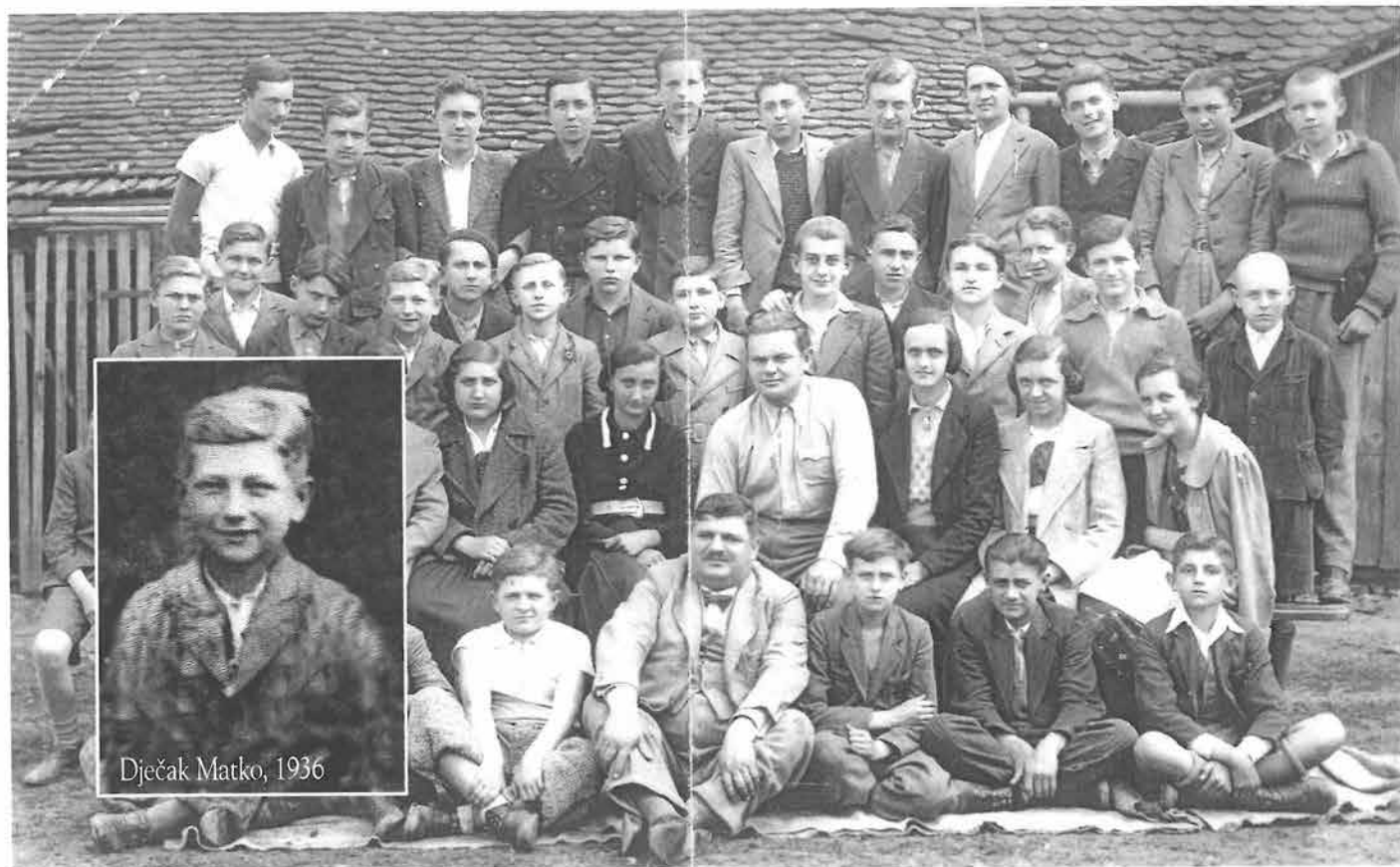
Matko u III raz. gimnazije ( 7. raz. OŠ), izlet u Feričance