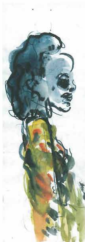
Žena ogrnuta šalom u haljini živih boja 17