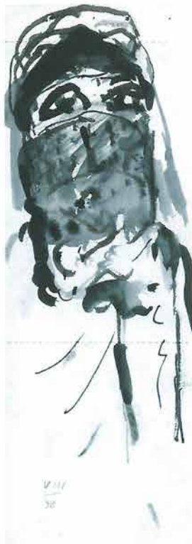
Žena sa zarom (bula), 1998. 15