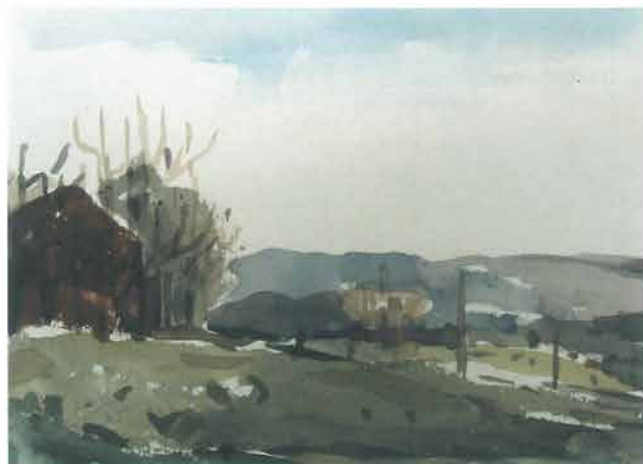
Tmurna panorama s dimnjakom, 1965.