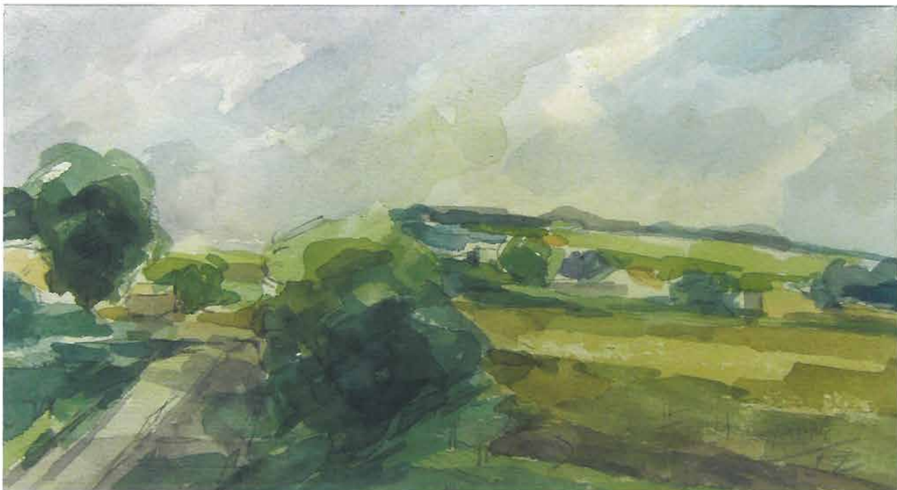
Pejzaž s cestom lijevo, 1952.