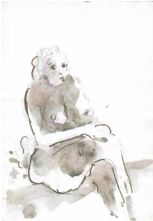
Akt žene koja sjedi prekrizhenih nogu