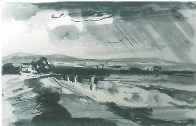
Okolo Orljave, 1955.