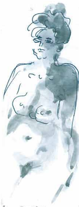
Žena podignute kose