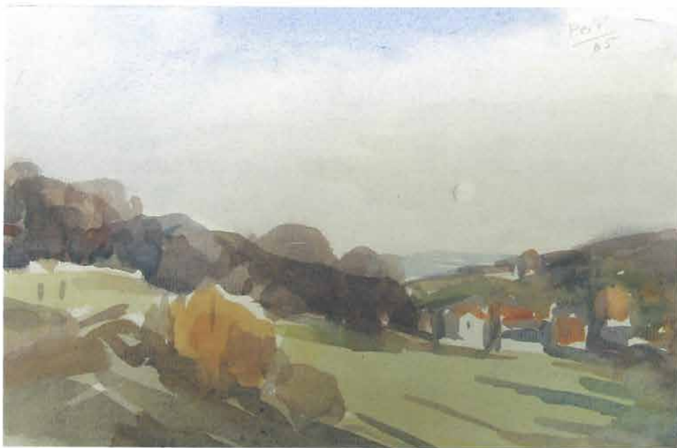
Pejzaž s mjesečevim krugom po danu, 1965.