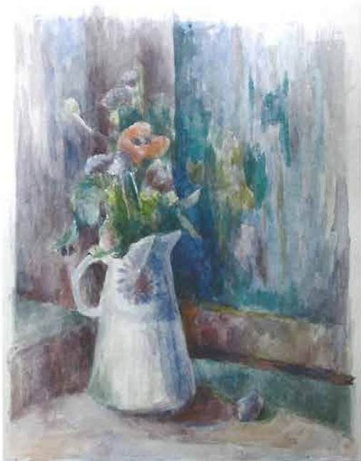
Bokal s poljskim cvijećem, 1950.