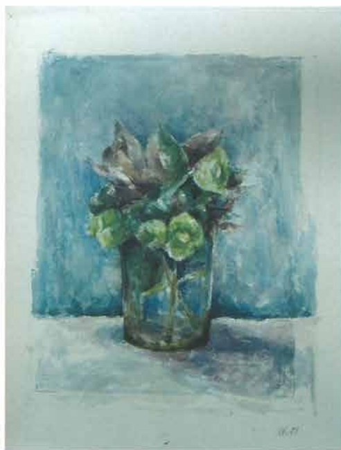
Cvjetni buketić u staklenoj čaši, 1951.