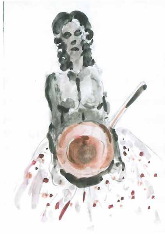
Dama sa šešišrom i točkasom suknom