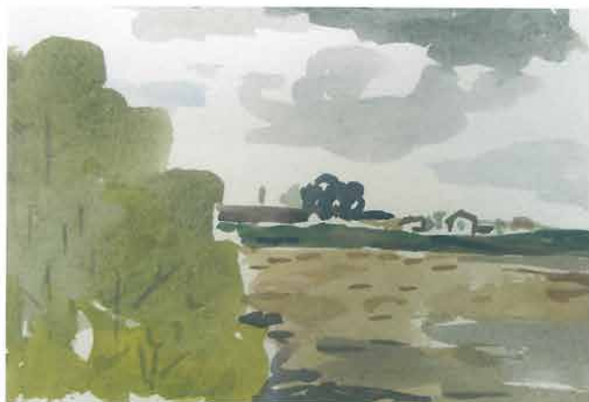
Pejzaž iza zelene krošnje, 1963.