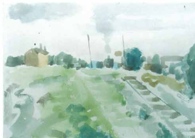
Požeški kolodvor ljeti, 1958.

Riječi su MATKA PEIĆA, akademskog slikara rođenog u Požegi, koje još i danas čujemo, deset godina, nakon što je odložio ne samo oštru olovku i "Lipa" notes, nego i male akvarel boje, kistić i bočicu od lijeka za vodu.