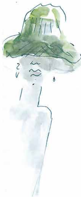
Žena u zelenom šeširu