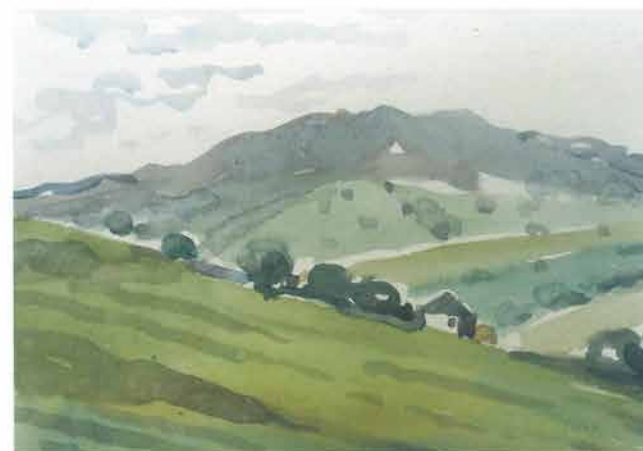
Kosina s brijegom u daljini, 1966.