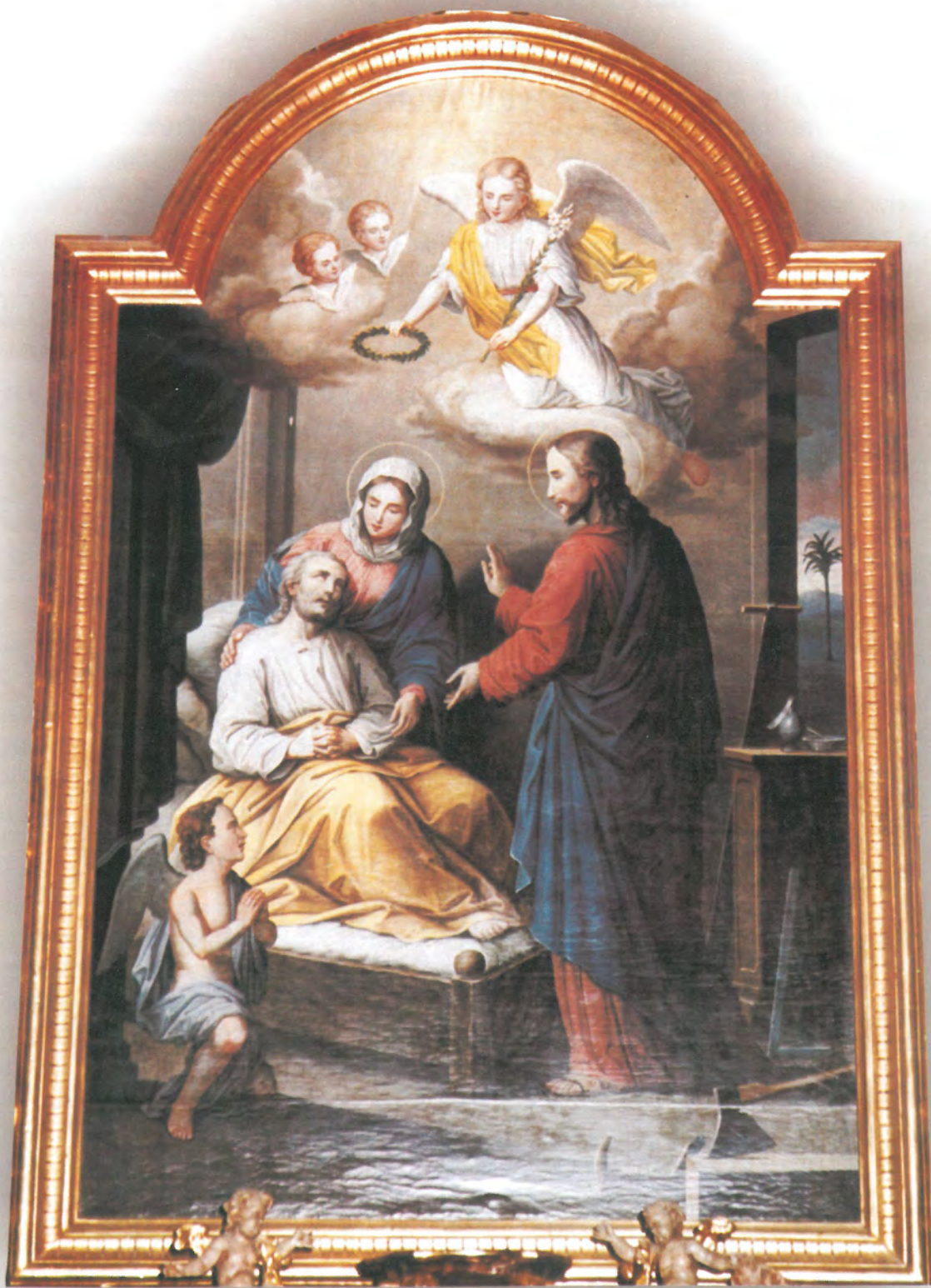
SMRT SV. JOISPA, crkva sv. Josipa, Lipovljani (kat br. 6)