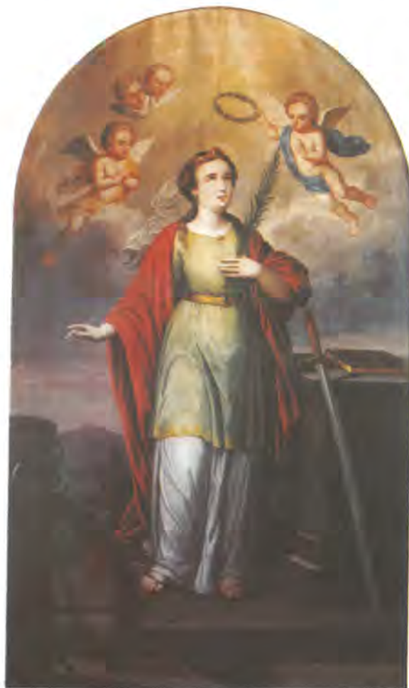
kat. br. 9.

Izložbom slika Ignaza Bergera želimo istaknuti brojnost djela koje je ovaj slikar slikao za područje današnje Požeške biskupije, nakon uzdignuća Zagrebačke biskupije u nadbiskupiju i utemeljenja Hrvatsko-slavonske crkvene pokrajine (11. prosinac 1852.) kao i uvođenja prvog nadbiskupa i metropolite (8. svibnja 1853.).