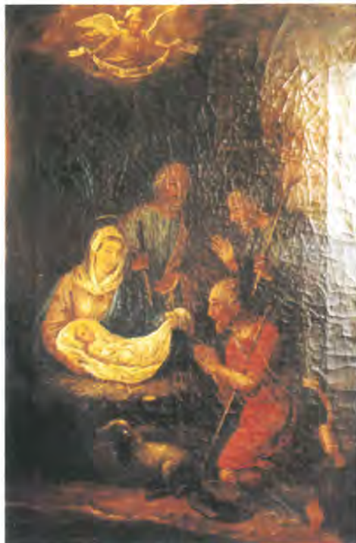
kat br. 3.