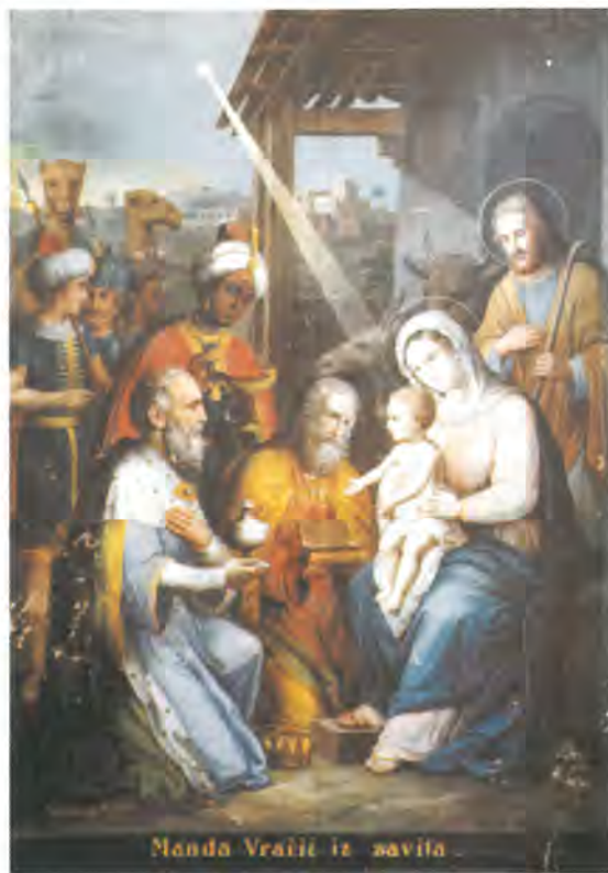
kat br. 4.