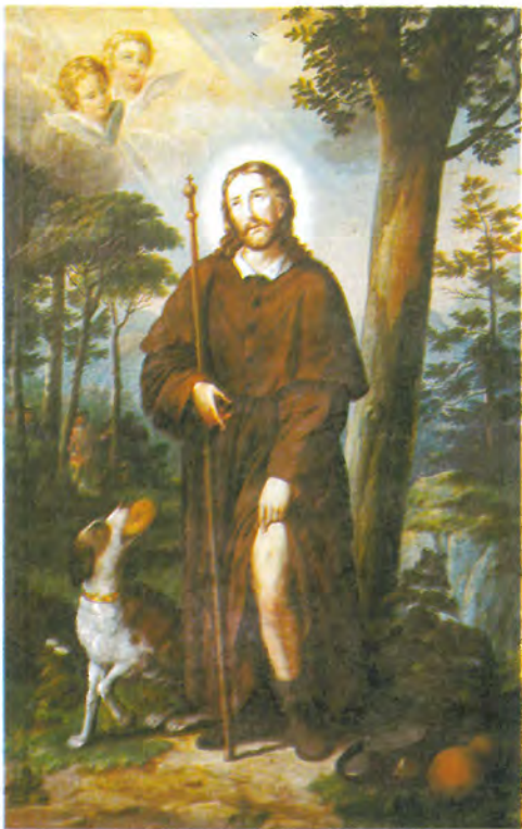
24. SV. ROK Ulje na platnu, 138 x 90 cm Šir. rame 8 cm Sign. nema Kapela sv. Roka Seoce