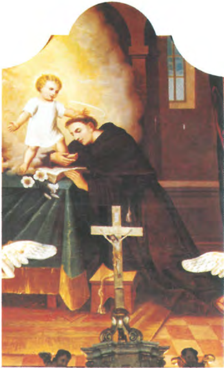
31. SV. ANTUN PADOVANSKI ulje na platnu sign. nema crkva sv. Antuna Padovanskog Staro Petrovo Selo /slika nije izložena, nalazi se na oltaru crkve/