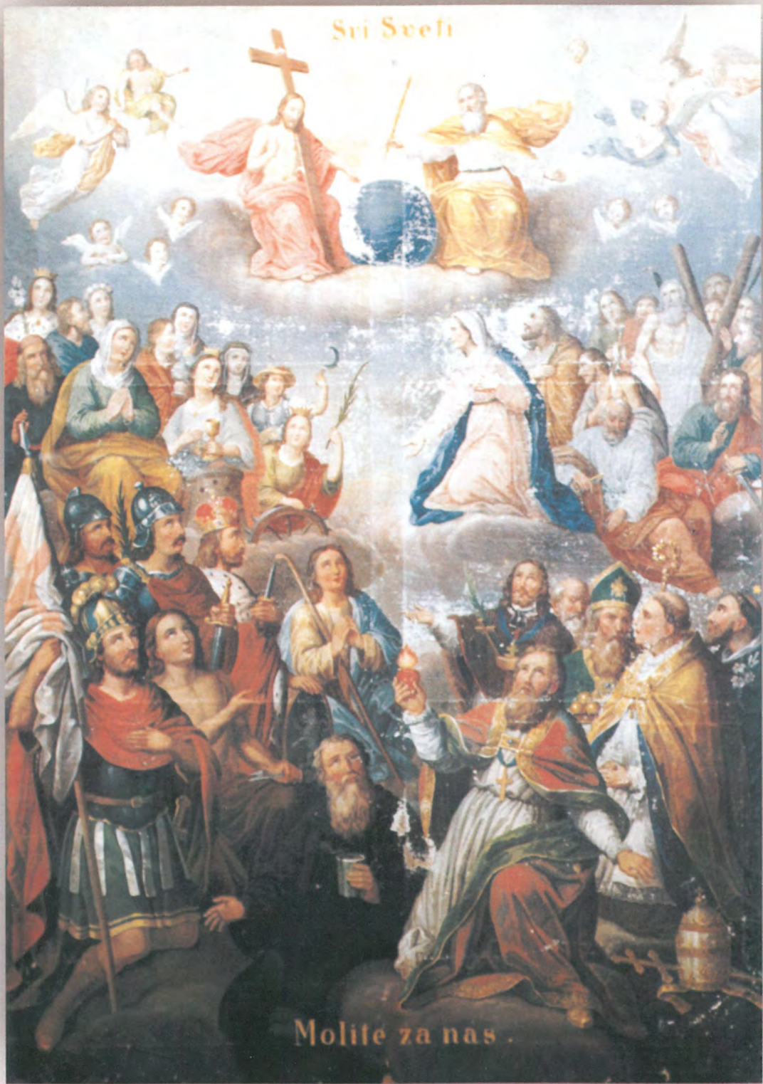
SVI SVETI, crkva sv. Jurja, Vrbova, kat. br. 10.