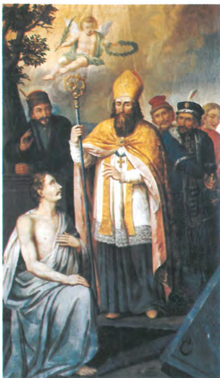
19. SV. STANISLAV KRAKOVSKI BISKUP ulje na platnu, 155 x 92,5 cm rama 6,5 cm Manja oltarna pala sign. nema crkva sv. Luke Srednji Lipovac