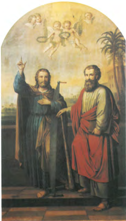
32. SV. ŠIMUN I JUDA TADEJ ulje na platnu, 163 x 94 cm rama 13 cm d.l. sign. Gemalt v. Ignaz Berger. in Neutitschein (Mähren) crkva sv Jurja , mučenika Čaglič