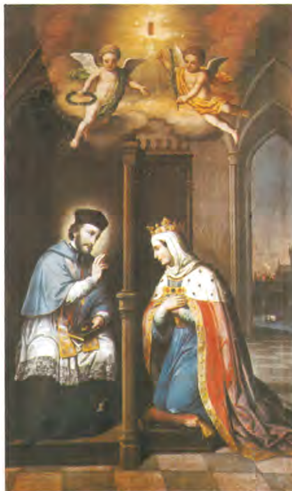
kat. br. 7.

Treba napomenuti da se u to vrijeme (1862., 1863., 1868.) nabavljaju i poklanjaju crkvama slike za novljansku župu, a pretpostavljamo da ih je mogao