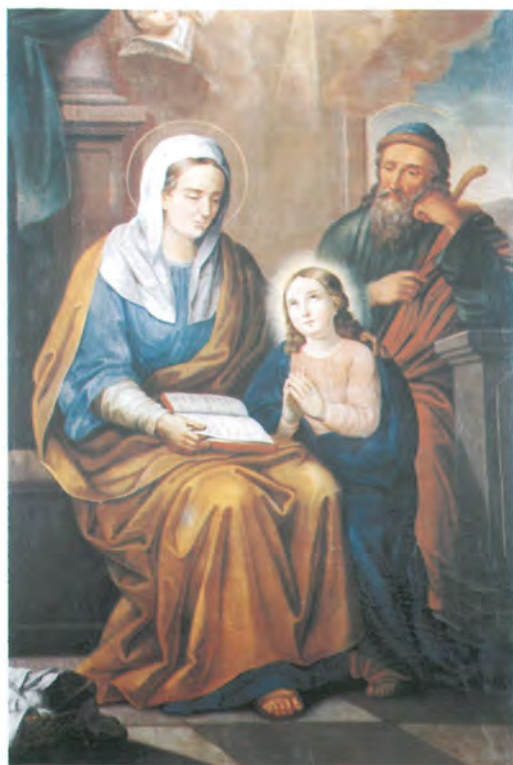
20. SV. ANA ulje na platnu, 154,5 x 92,5 cm rama šir. 6,5 cm sign. nema Manja oltarna pala crkva sv. Luke Srednji Lipovac