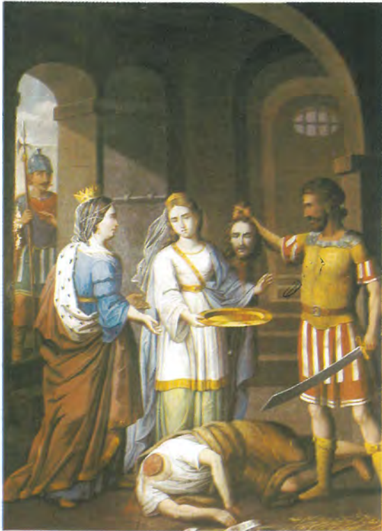
23. GLAVOSJEK SV. IVANA KRSTITELJA Ulje na platnu, 156 x 109 cm Rama 9,5 cm Sign. d.l. Gemalt v. Ignaz Berger Neutitsch in Mähren kapela Mučeništva sv. Ivana Krstitelja Magić Mala

/ sliku je 1877. godine poklonio kapeli natporučnik Nikola Vračić rodom iz Magić Male. Slika je navodno nabavljena u Neutitscheimu u Moravskoj)