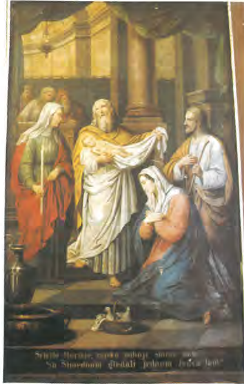
kat br. 5.

Nešto je iskreno i ljudski duboko u svim njihovim fizionomijama. Položaj i izraz ruku malog Božića koji na djetinji način pruža ruke, a ne traži, dio je te posebne doživljenosti.