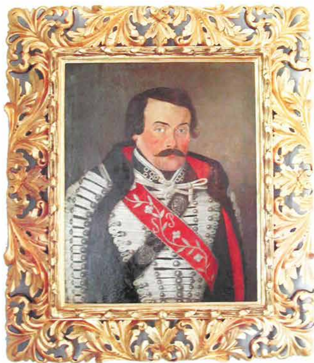
4. NEPOZNATI AUTOR PORTRET MUŠKARCA U PLAVOJ ODORI, 18 / 19 ST. Ulje na platnu, 65 x 52 cm slika uramljena u venecijanski tip rame

Slika prikazuje muškarca s brkovima u plavoj svečanoj vojnoj odori. Prema muzejskom zapisu djelo pripada kraju 18. stoljeća i početku 19. stoljeća. Portretirana osoba na slici svojim načinom držanja i odorom predstavlja dostojanstvenika, čiji su inicijali S P ispisani uz ukrasnu viticu na crvenoj lenti. Slika na određen način svjedoči i o statusu vojnih osoba u Požegi u vrijeme nastanka slike. Sliku je izradio slikar koji je vrlo vješt u slikanju odjeće što svjedoči i pomno prikazan svečani ogrtač sa svim njegovim detaljima. Muzej u svojem fundusu čuva brojne portrete požeških župana, ali i portrete poznatih i nepoznatih osoba požeške prošlosti. Restauracija ove vrste slika bila je neophodno potrebna kako se ne bi zajedno s ovim umjetninama u nepovrat izgubio i značajan umjetnički i povijesni dokument vremena kada je Požega bila jedan od važnijih kulturnih, društvenih i vojnih centara ne samo Slavonije nego i Europe.