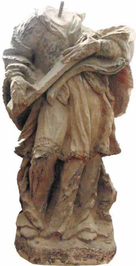
10. NEPOZNATI UMJETNIK SV. IVAN NEPOMUK, 1728. g. Kamen, vis. 110cm , šir. 60cm