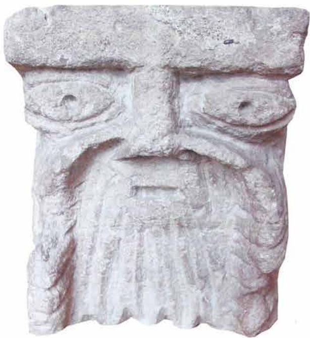
12. RUDINA Kamena konzola Romanička crkv sv. Mihovila benediktinskog samostana, 12. st.

Romanička crkva sv. Mihovila nalazi se u sklopu benediktinskog samostana u 12. stoljeću. Samostan se nalazi 25 km od Požege i jedini je primjer takvog objekta u kontinentalnoj Hrvatskoj. Arheološki nalazi ukazuju na kontinuitet življenja na mjestu samostana od prapovijesti, Rimljana, prvih kršćana, te benediktinaca koji su ovdje imali mjesto svoje molitve.