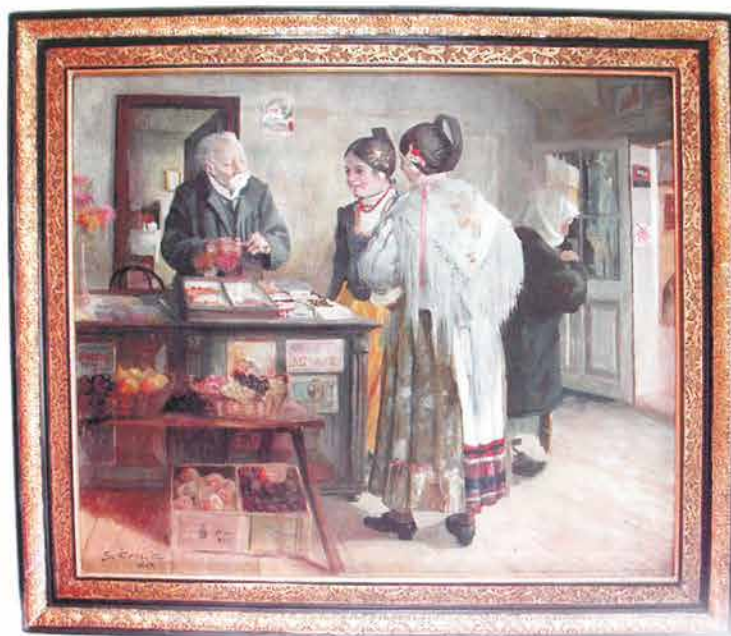
7. STJEPAN ČALIĆ SELJANKE U TRGOVINI, 1917. g. ulje na platnu, 110 x 92 cm

Slika prikazuje trgovinu u kojoj kupuju tri žene odjevene u tri tipa požeške narodne nošnje. Za trgovačkim pultom stoji malo pogrbljeni ostarjeli trgovac, po fizionomiji čini se da je Židov. Ispred njih je roba za prodaju. Kroz otvorena vrata naziru se požeške bolte.