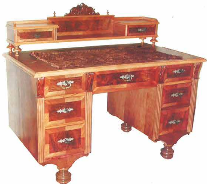
8. PISAĆI STOL IZ OBITELJI KUŠEVIĆ Blacko, druga pol. 19. st. Drvo, furnir