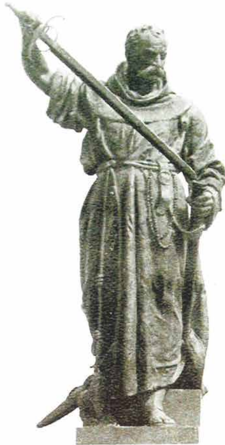
11. GYORGY KISS FRA LUKA IBRIŠIMOVIĆ SOKOL, 1893. g. kiparska studija, 80 cm, gips

Fra Luka Ibrišimović Sokol, franjevac i narodni junak poveo je u ožujku 1688. godine Požežane u borbu za oslobođenje od Turaka, koji su vladali ovim krajevima 150 godina. Konačno oslobođenje Požega je doživjela 1691. godine, te su građani povodom 200. obljetnice obilježavanja ovog događaja podigli na Trgu sv. Terezije fra Luki vrijedan spomenik. Izradio ga je mađarski kipar György Kiss. Spomenik je svečano postavljen 5. studenog 1893. godine.